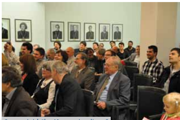
Sotvorenja izložbe „Na ramenima divova“

Fakultet strojarstva i brodogradnje Sveučilišta u Zagrebu već tradicionalno u mjesecu studenome obilježava svoje dane, pri čemu je ove godine obilježeno 97 godina od osnutka i 60 godina rada kao samostalnog fakulteta. Tim povodom organizirana su od 15. do 18. studenog 2016. različita događanja s ciljem predstavljanja Fakulteta, studentskih udruga i povezanosti s hrvatskim gospodarstvom. Tako je 15. studenog otvorena izložba pod naslovom „Na ramenima divova“ na kojoj je prikazana djelatnost petorice profesora koji su svojom djelatnošću najviše zaslužni za razvoj i ugled Fakulteta. Inicijatorica izložbe jeste dr. sc. Tea Žakula, docentica na FSB-u. To su (abecednim redom) prof. dr. sc. Davorin Bazjanac, prof. dr. sc. Fran Bošnjaković, prof. dr. Aleksandar Đurašević, prof. Leopold Sotra i prof. dr. sc. Stepan P. Timošenko. Izloženi su preslici naslovnica knjiga i znanstvenih radova koje su objavili te neki rukopisi i osobni predmeti. Na samom otvorenju o njihovom radu kratko su govorili profesori s FSB-a koji su s njima surađivali ili se bave sa srodnim područjem.