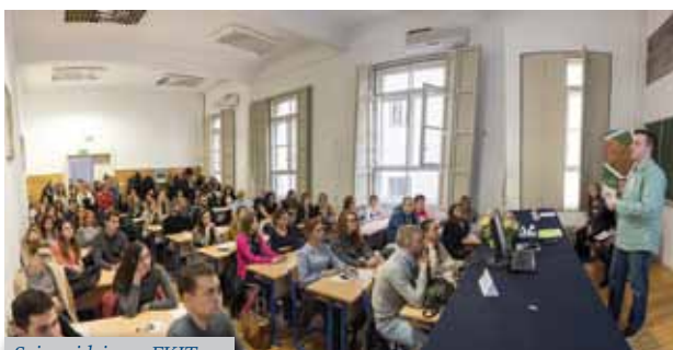
Sajam ideja na FKIT-u

Kako bi se intenzivirala i unaprijedila suradnja s gospodarstvom, što je jedan od strateških ciljeva Fakulteta kemijskog inženjerstva i tehnologije, osnovano je Gospodarsko vijeće Fakulteta kojeg čine aktivni zainteresirani nastavnici s Fakulteta i ugledni stručnjaci – prijatelji Fakulteta iz gospodarstva i javnih institucija. Vijeće će sudjelovati u definiranju kompetencija koje bi trebali imati budući zaposlenici i završeni studenti FKIT-a. Gospodarsko vijeće također će potpomagati i koordinirati akcije Fakulteta oko reguliranja profesije kemijskih inženjera u Hrvatskoj. Planira se i intenziviranje osnivanja spin-off tvrtki Fakulteta i podrške njihovom radu.