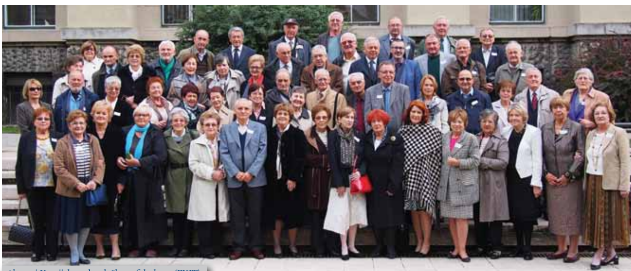
Alumni Kemijsko-tehnološkoga fakulteta (FKIT)