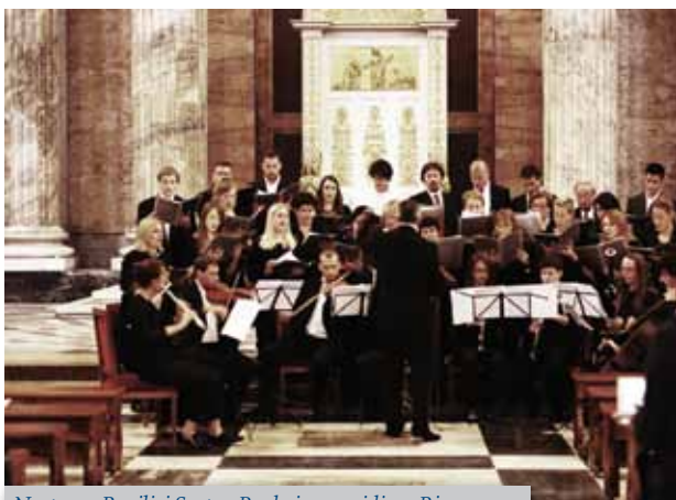
Nastup u Bazilici Svetog Pavla izvan zidina, Rim, 2014.