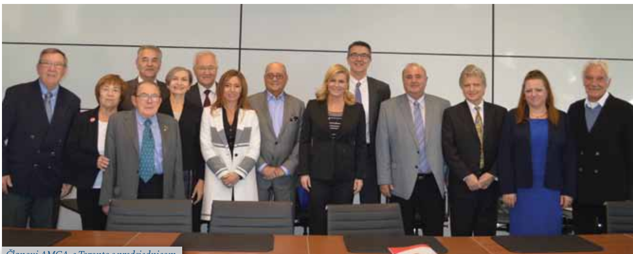
Članovi AMCA-e Toronto s predsjednicom

AMCA-e Toronto gđa Grabar-Kitarović je zahvalila na njihovom radu, čestitala na svim dosadašnjim uspjesima te pozvala da nastave podržavati i promovirati hrvatsku kulturu i Hrvatsku uopće.