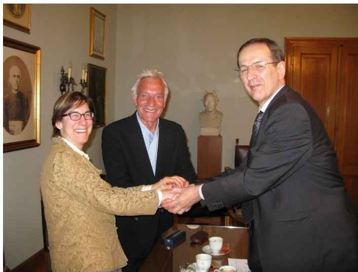
Potpisivanje Ugovora o suradnji između Sveučilišta u Zagrebu i Sveučilišta u Torontu