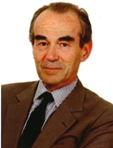
ROBERT BADINTER (Paris, 30. 3. 1928.) 89. počasni doktor Sveučilišta u Zagrebu, promoviran 17. travnja 2003.