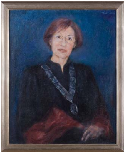
Portret H. J. Mencer (Galerija rektora - aula) Autor: Zlatko Kauzarić Atač, Zagreb 2006.