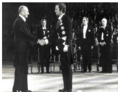
Vladimir Prelog preuzima Nobelovu nagradu od švedskog kralja Gustava (1975.)