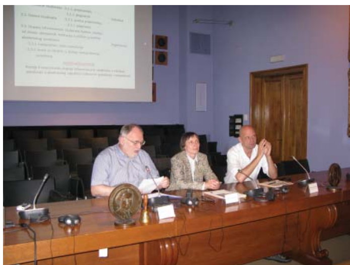
Sa simpozija o korupciji i diskriminaciji