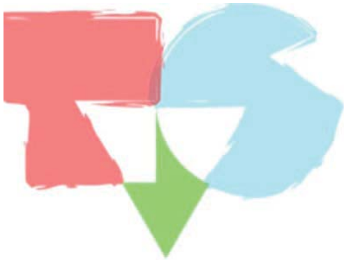
Logo Televizije Student

6. studenoga 2012. - u sklopu proslave 50. obljetnice Fakulteta političkih znanosti Sveučilišta u Zagrebu svoj je program počela emitirati prva hrvatska studentska televizija – Televizija Student. TV Student televizijski je kanal koji stvaraju studenti i mladi profesionalci. Projekt su kreirali profesori i studenti Fakulteta političkih znanosti, u čemu im se pridružila i Akademija dramske umjetnosti Sveučilišta u Zagrebu. Zajedno s Hrvatskom akademskom i istraživačkom mrežom CARNet, ti mladi ljudi rade na povezivanju i razmjeni videosadržaja unutar Sveučilišta u Zagrebu, a cilj im je da im se priključe svi mladi i kreativni ljudi sa svih fakulteta odnosno da TV Student postane generacijski projekt.