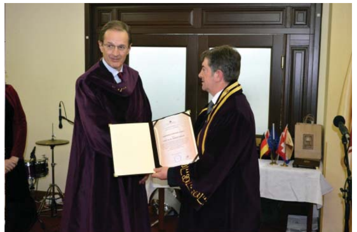
S dodjele počasnoga zvanja professor honoris causa Sveučilišta "St. Kliment Ohridski" u Bitoli