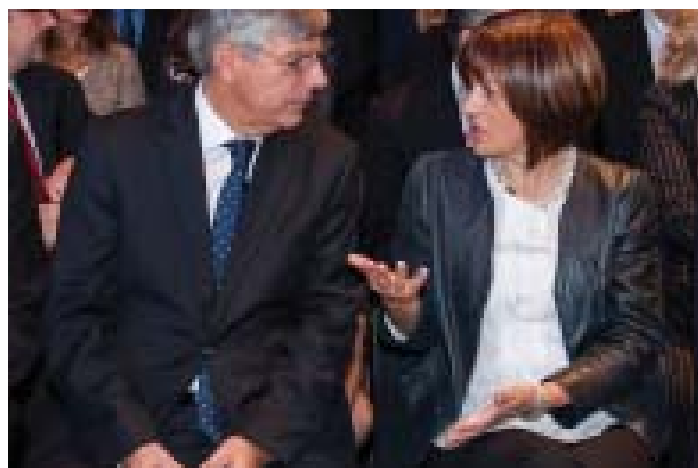
Uzvanici na svečanoj sjednici Senata Sveučilišta u Zagrebu