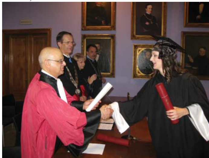
Podjela diplona magistra iz područja bioindustrije