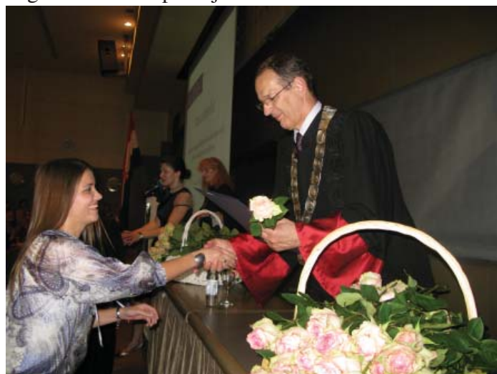
Dodjela Rektorove nagrade