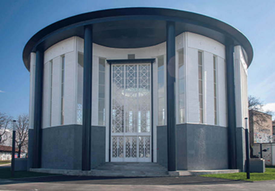
Obnovljeni Francuski paviljon u dvorištu Studentskog centra Zagreb.