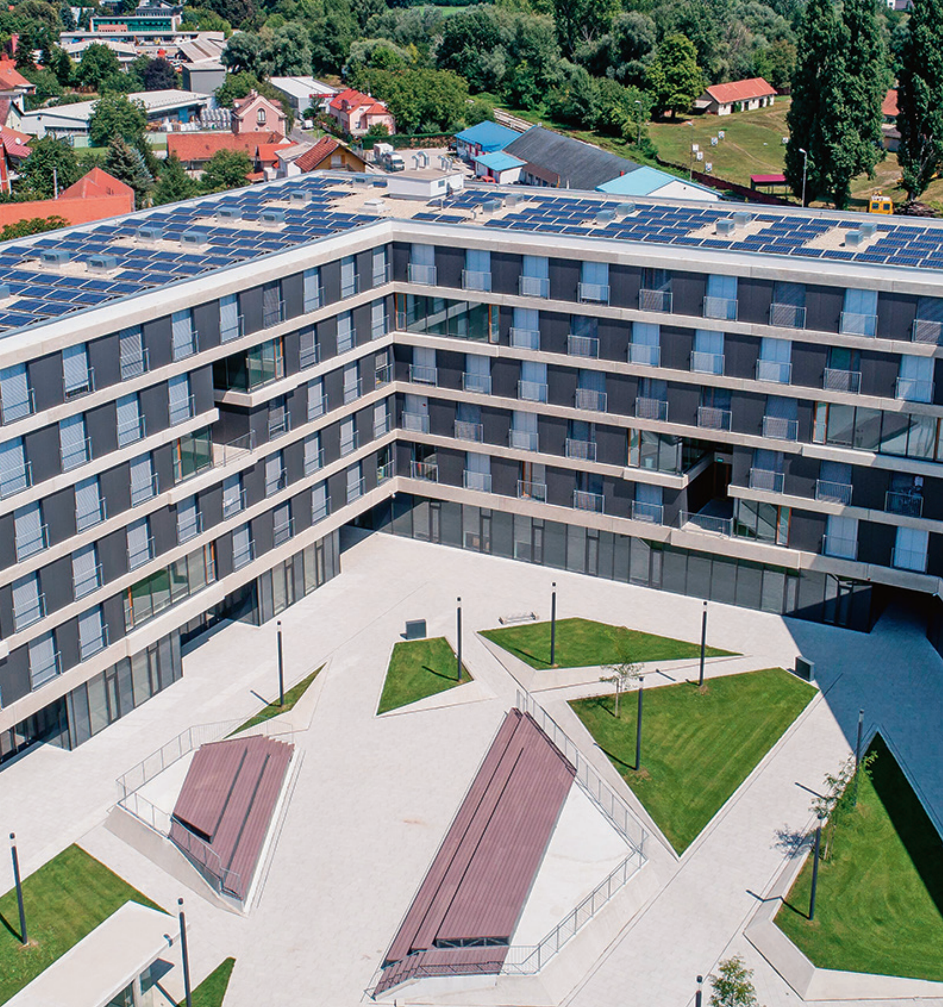
Studentski dom u Varaždinu.