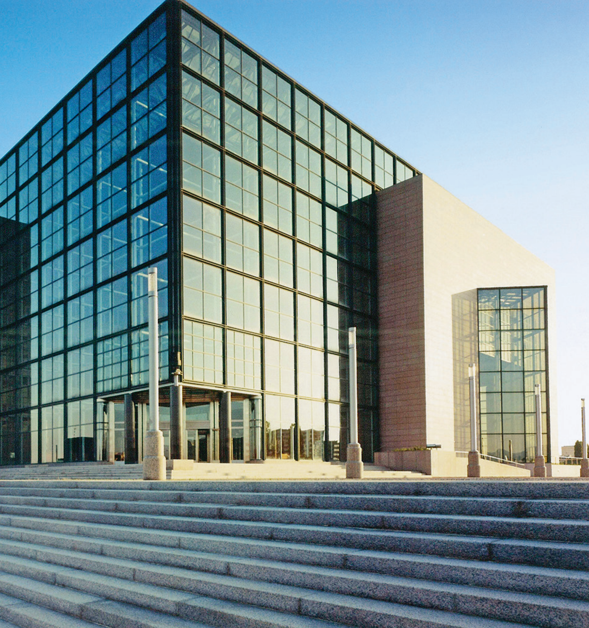
Nacionalna sveučilišna knjižnica u Zagrebu.