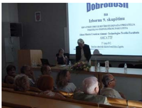
9. skupština Udruge, 27. lipnja 2012.