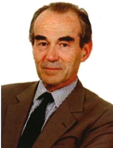
ROBERT BADINTER (Paris, 30. 3. 1928.) 89. počasni doktor Sveučilišta u Zagrebu, promoviran 17. travnja 2003.