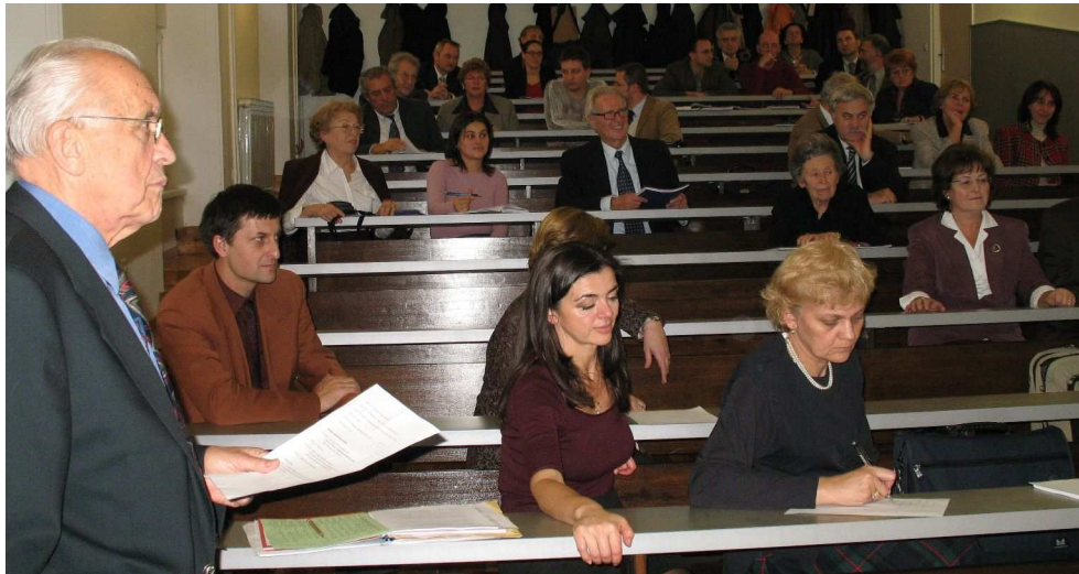
Sa sjednice Sabora AMAC Saveza društava bivših studenata i prijatelja Sveučilišta u Zagrebu – 26. studenoga 2006.