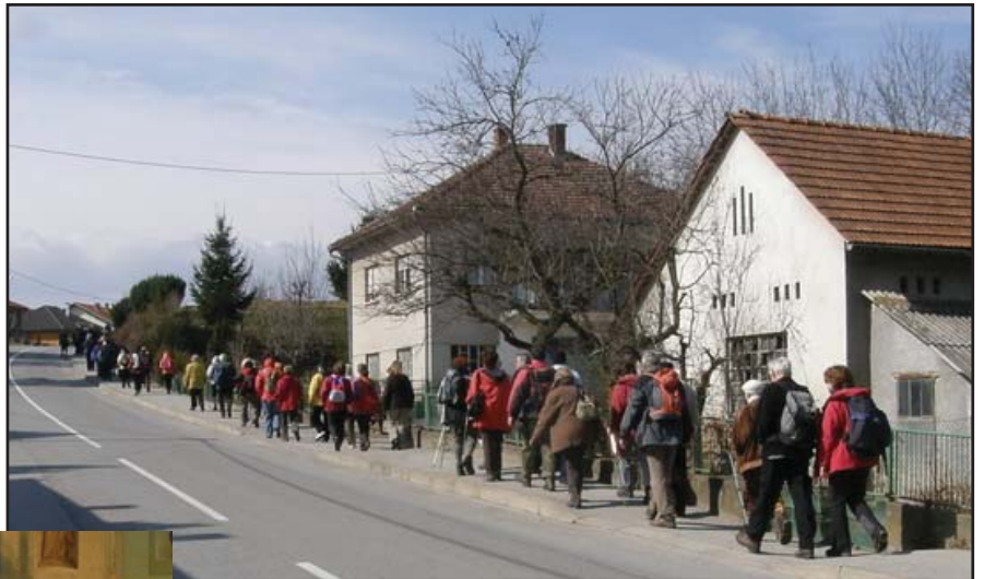
S izleta AMACIZ-a u Međimurje