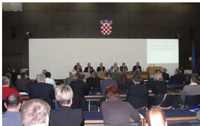
Sudionici ZIRP-a 2012 tijekom jedne od panel diskusija

Savjetovanje je okupilo stotinjak sudionika iz znanstvenih institucija, gradskih i državnih poduzeća te ostalih gospodarskih subjekata. Prijavljen je 41 rad koji su izvjestitelji prezentirali sukladno tematskoj skupini kojoj pojedini rad pripada.