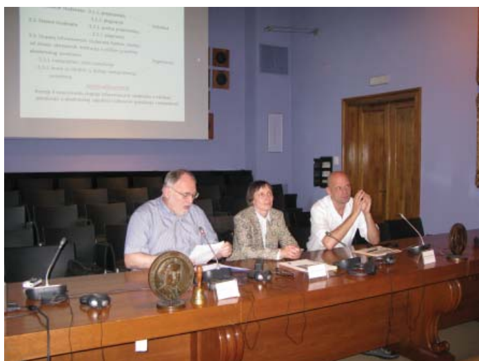
Sa simpozija o korupciji i diskriminaciji