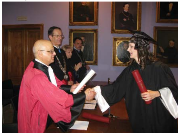
Podjela diplona magistra iz područja bioindustrije