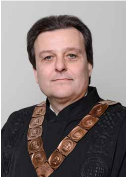
red. prof. art. MLADEN JANJANIN prorektor za umjetničko područje i međunarodni položaj Sveučilišta u Zagrebu

Rođen je 1962. u Vinkovcima. Diplomirao je klavir na Royal College of Music u Londonu sa samo 19 godina kao najmlađi diplomant u povijesti ove institucije. Završio je poslijediplomski studij klavira na Muzičkoj akademiji Sveučilišta u Zagrebu. Suradivao je s brojnim istaknutim svjetskim umjetnicima i pedagogima, a posebno je značajna njegova profesionalna suradnja s britanskim orguljašem i pijanistom Wayneom Marshallom s kojim već dugo godina uspješno nastupa. Bio je prodekan za međunarodnu suradnju i informatiku (od 2001.) te dekan Muzičke akademije Sveučilišta u Zagrebu u dva mandata. Začetnik je suradnje triju umjetničkih akademija Sveučilišta u Zagrebu, čime je osnažen utjecaj umjetničkog područja na razini Sveučilišta te obogaćen kulturni život Grada Zagreba. Obnašao je funkciju člana Kulturnog vijeća za glazbu pri Ministarstvu kulture Republike Hrvatske, bio je CMU koordinator pri CARNet-u, 2009. imenovan je članom Matičnog odbora za umjetnost pri Ministarstvu znanosti, obrazovanja i sporta, a odlukom Sabora Republike Hrvatske u listopadu 2011. imenovan je članom Nacionalnog vijeća za znanost. Dobitnik je brojnih nagrada i priznanja. Dao je poseban doprinos u realizaciji projekta izgradnje nove zgrade Muzičke akademije Sveučilišta u Zagrebu.