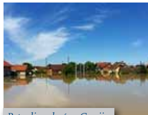
Potopljene kuće u Gunji

ne vode studenti su crtali i ispisivali lijepe i tople poruke kako bi barem na trenutak humanom blagošću dotaknuli stanovnike naselja Gunja, Rajevo selo... Studenti su brzo povezali organizacijske konce (od brojeva telefona do organizacije prijevoza) i u samo tjedan dana prikupljanja dostavili priloge obiteljima u potrebi.