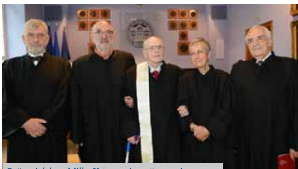
Počasni doktor Milko Kelemen i stručno povjerenstvo