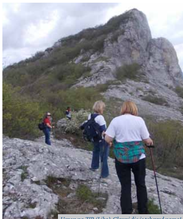
Uspon na ZIR (Lika), Glavni dio je tek pred nama!

Planinarsko-izletnička sekcija je među aktivnijim sekcijama, s redovitim mjesečnim izletima u razna mjesta Hrvatske, a ponekad i u bliže susjedstvo. Ove jeseni održani su izleti na Zir (Lika), Parenzanu (stara željeznička pruga u blizini Motovouna i Oprtija), u Bosansku Krupu (BiH), na Goli Otok i Sv. Grgur, te u Staru Marču i Ivanić-Grad. Lijepa tradicija nastavit će se i tijekom zime i proljeća 2015.