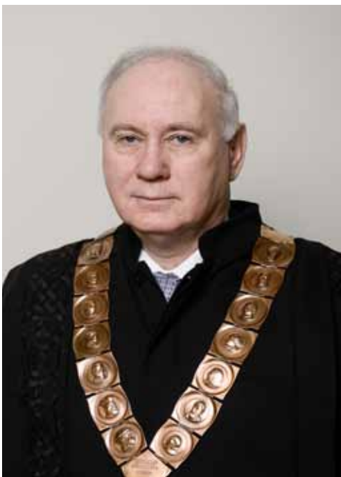
prof. dr. sc. ANTE ČOVIĆ prorektor za organizaciju, kadrovski razvoj i međusveučilišnu suradnju Sveučilišta u Zagrebu

Rođen je 1949. u Splitu. Na Filozofskom fakultetu Sveučilišta u Zagrebu diplomirao je 1975. filozofiju i latinski jezik. Godine 1976. završio je poslijediplomski tečaj Ethik und Gesellschaftstheorie na Interuniverzitetskom centru za postdiplomske studije u Dubrovniku, a doktorsku disertaciju obranio je 1989. na Filozofskom fakultetu Sveučilišta u Zagrebu. Od 1993. predstojnik je Katedre za etiku, a od 2010. pročelnik Odsjeka za filozofiju Filozofskog fakulteta Sveučilišta u Zagrebu. Od njegovog osnivanja 2006., voditelj je Referalnog centra za bioetiku u jugoistočnoj Europi. Obnašao je brojne dužnosti, između ostaloga, bio je ministar znanosti, tehnologije i informatike u Vladi demokratskog jedinstva Republike Hrvatske (1991.-1992.), potpredsjednik Bioetičkog povjerenstva Vlade Republike Hrvatske za praćenje genetski modificiranih organizama (2000.-2003.) te član Vijeća za GMO Vlade Republike Hrvatske (2008.-2013.). Član je Hrvatskog filozofskog društva u kojem je obnašao dužnost tajnika, a zatim i predsjednika. Jedan je od osnivača Kluba hrvatskih humboldtovaca te Hrvatskog bioetičkog društva. Dobitnik je Spomenice domovinskog rata (1993.), Povelje Hrvatskoga sabora za izniman doprinos u stvaranju samostalne i suverene Hrvatske (2010.), Nagrade Grada Zagreba za znanost (2014.) te drugih nagrada i priznanja. Bio je glavni i odgovorni urednik nekoliko domaćih i međunarodnih časopisa.