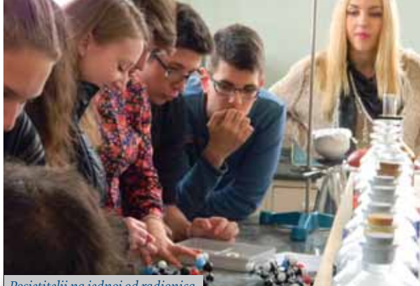
Posjetitelji na jednoj od radionica

Farmaceutsko-biokemijski fakultet Sveučilišta u Zagrebu po treći put otvorio je svoja vrata široj javnosti 15. studenoga 2014. i kroz radionice o temi Od molekule do lijeka predstavio farmaceutsku i medicinsko-biokemijsku struku.