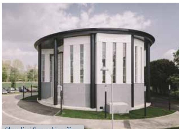
Obnovljeni Francuski paviljon

izložbeni paviljon Republike Francuske u sklopu sajamske priredbe Zagrebački zbor, koja se tada prvi put održala na novoj adresi u Savskoj ulici. Francuski arhitekt Robert Camelot i građevinski inženjer Bernard Lafaille imali na raspolaganju šest mjeseci za projektiranje i isto toliko za gradnju zahtjevnog jednodimenzionalnog paviljona kružnog tlocrta površine oko 600 m 2 . Ograničeni rokovima, odlučili su se na gotovo montažnu gradnju: vanjski nenasivi zid od armiranog betona i drveta te krov u obliku obrnutog stošca koji drži čelični prsten a nose čelični stupovi. Obnovljeni paviljon ubuduće će ugošćivati izložbene i kazališne projekte, a o programima će odlučivati povjerenstvo triju partnera koji su i sudjelovali u njegovoj obnovi: Grad Zagreb, Studentski centar i Sveučilište u Zagrebu.