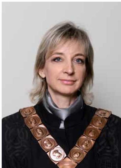
prof. dr. sc. IVANA ČUKOVIĆ-BAGIĆ prorektorica za studente, studije i upravljanje kvalitetom Sveučilišta u Zagrebu

Rođen je 1949. u Splitu. Na Filozofskom fakultetu Sveučilišta u Zagrebu diplomirao je 1975. filozofiju i latinski jezik. Godine 1976. završio je poslijediplomski tečaj Ethik und Gesellschaftstheorie na Interuniverzitetskom centru za postdiplomske studije u Dubrovniku, a doktorsku disertaciju obranio je 1989. na Filozofskom fakultetu Sveučilišta u Zagrebu. Od 1993. predstojnik je Katedre za etiku, a od 2010. pročelnik Odsjeka za filozofiju Filozofskog fakulteta Sveučilišta u Zagrebu. Od njegovog osnivanja 2006., voditelj je Referalnog centra za bioetiku u jugoistočnoj Europi. Obnašao je brojne dužnosti, između ostaloga, bio je ministar znanosti, tehnologije i informatike u Vladi demokratskog jedinstva Republike Hrvatske (1991.-1992.), potpredsjednik Bioetičkog povjerenstva Vlade Republike Hrvatske za praćenje genetski modificiranih organizama (2000.-2003.) te član Vijeća za GMO Vlade Republike Hrvatske (2008.-2013.). Član je Hrvatskog filozofskog društva u kojem je obnašao dužnost tajnika, a zatim i predsjednika. Jedan je od osnivača Kluba hrvatskih humboldtovaca te Hrvatskog bioetičkog društva. Dobitnik je Spomenice domovinskog rata (1993.), Povelje Hrvatskoga sabora za izniman doprinos u stvaranju samostalne i suverene Hrvatske (2010.), Nagrade Grada Zagreba za znanost (2014.) te drugih nagrada i priznanja. Bio je glavni i odgovorni urednik nekoliko domaćih i međunarodnih časopisa.