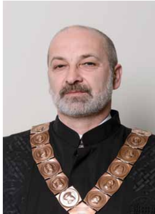
prof. dr. sc. MILOŠ JUDAŠ prorektor za znanost, međuinstitucijsku i međunarodnu suradnju Sveučilišta u Zagrebu

Rođen je 1962. u Vinkovcima. Diplomirao je klavir na Royal College of Music u Londonu sa samo 19 godina kao najmlađi diplomant u povijesti ove institucije. Završio je poslijediplomski studij klavira na Muzičkoj akademiji Sveučilišta u Zagrebu. Suradivao je s brojnim istaknutim svjetskim umjetnicima i pedagogima, a posebno je značajna njegova profesionalna suradnja s britanskim orguljašem i pijanistom Wayneom Marshallom s kojim već dugo godina uspješno nastupa. Bio je prodekan za međunarodnu suradnju i informatiku (od 2001.) te dekan Muzičke akademije Sveučilišta u Zagrebu u dva mandata. Začetnik je suradnje triju umjetničkih akademija Sveučilišta u Zagrebu, čime je osnažen utjecaj umjetničkog područja na razini Sveučilišta te obogaćen kulturni život Grada Zagreba. Obnašao je funkciju člana Kulturnog vijeća za glazbu pri Ministarstvu kulture Republike Hrvatske, bio je CMU koordinator pri CARNet-u, 2009. imenovan je članom Matičnog odbora za umjetnost pri Ministarstvu znanosti, obrazovanja i sporta, a odlukom Sabora Republike Hrvatske u listopadu 2011. imenovan je članom Nacionalnog vijeća za znanost. Dobitnik je brojnih nagrada i priznanja. Dao je poseban doprinos u realizaciji projekta izgradnje nove zgrade Muzičke akademije Sveučilišta u Zagrebu.