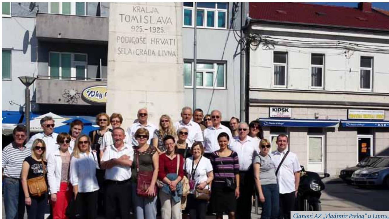
Članovi AZ „Vladimir Prelog” u Livnu, ispred spomenika Kralju Tomislavu

U prošlom je broju Glasnika detaljno opisana aktivnost AMACIZ-a, Društva diplomiranih inženjera i prijatelja Kemijsko-tehnološkog studija Sveučilišta u Zagrebu. Ovdje navodimo samo najvažnije aktivnosti provedene u proteklih 6 mjeseci i najavljujemo obilježavanje 25. obljetnice Društva.