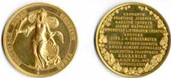
Zlatna kovana spomen medalja osnutka Sveučilišta 1874. godine promjera 45 mm, Arheološki muzej u Zagrebu i Arhiva Sveučilišta u Zagrebu

Zakonski članak sabora kraljevina Dalmacije Hrvatske i Slavonije od 5. siječnja 1874. ob ustrojstvu sveučilišta Franje Josipa I. u Zagrebu potvrđen je sankcijom vladara, svečano je to objavio ban Ivan Mažuranić. Time je, pet godina nakon potpisa zakonskoga članka u Budimu i mukotrpnoga djelovanja niza zaslužnih građana otvoren put osnutku modernoga sveučilišta. Sveučilište je trebalo imati četiri fakulteta – Bogoslovni, Pravni, Mudroslovni i Liječnički. Prva dva već su postojala. Bogoslovni u okviru sjemeništa, a Pravni u okviru Pravoslavne akademije. Mudroslovni je imao filozofičko-historički odjel , a od 1876. matematičko-prirodoslovni odjel , dok je osnivanje Liječničkog fakulteta bilo odgođeno. U prigodi proslave 140. godišnjice od osnutka modernoga sveučilišta, 17. listopada 2014. u 12 sati Filozofski fakultet je tako proslavio i svoj dan.