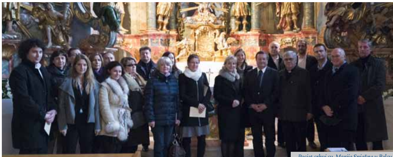
Posjet crkvi sv. Marije Snježne u Belcu

Organiziran je posjet predstavnika fakulteta, studentskih udruga, alumni udruge, kompanije INA te Sveučilišta u Zagrebu jednoj od najljepših baroknih crkvi u Hrvatskoj, crkvi sv. Marije Snježne u Belcu. Crkva je svoj današnji oblik dobila u XVI-II. stoljeću, kada je izrađeno pet raskošnih oltara, među njima i oltar sv. Barbare, zaštitnice rudara i opasnih zanimanja.