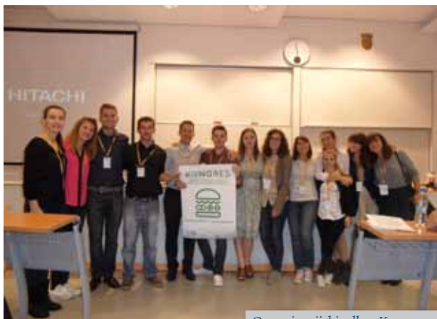
Organizacijski odbor Kongresa

Udruga studenata farmacije i medicinske biokemije Hrvatske ove godine organizirala je svoj prvi