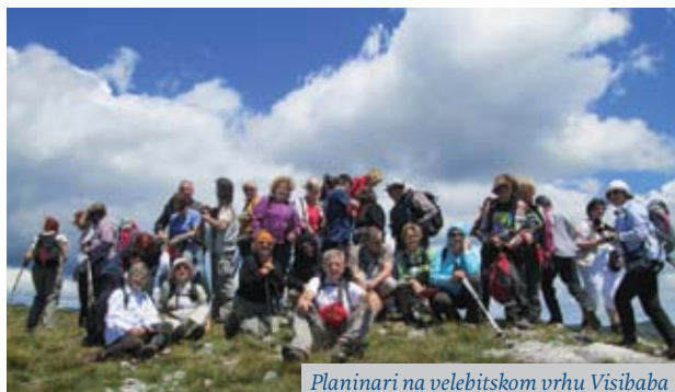
Planinari na velebitskom vrhu Visibaba

Planinarsko-izletnička sekcija gotovo svaki mjesec organizira izlete na vrlo atraktivna odredišta. Tako su alumni AMACIZ-a u 2014. i 2015. osvojili slikoviti i zahtjevan vrh Zir usred Like, pohodili burni Srednji Velebit i više puta prohodali trasom povijesne željezničke pruge Parenzane koja je povezivala Poreč i Trst preko unutrašnjosti Istre. Posebne emocije pobudio je izlet na Goli Otok i Sv. Grgur te dvodnevni izlet u Vukovar i Ilok, o kojima vrijedi pročitati izvještaje objavljene u Glasniku AMACIZ-a.