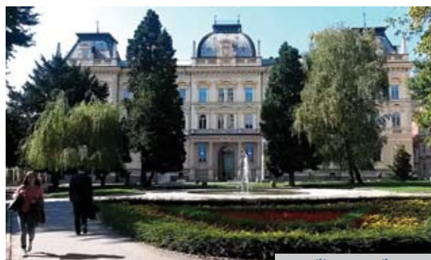
Sveučilište u Mariboru