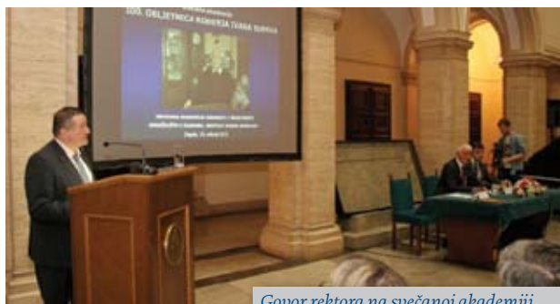
Govor rektora na svečanoj akademiji