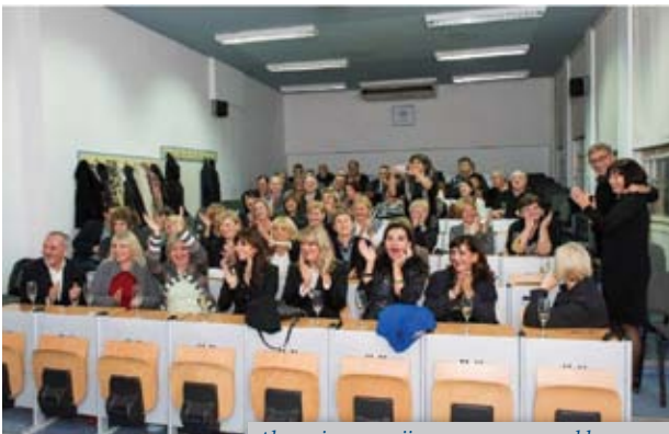
Alumni generacije 1975. ponovno u klupama

Prema tradiciji AMA SFZG, alumni udruge Stomatološkog fakulteta u Zagrebu i sastajanja bivših studenata, organiziran je sastanak generacije stomatologa upisanih na Stomatološki fakultet 1975. godine, a koja je absolvirala i/ili diplomirala 1980. i 1981. godine. Ova generacija sastala se 17.10.2015. u prostorijama Predavaonice Stomatološkog fakulteta, Gundulićeva 5. Dakle, bilo je to 40 go-