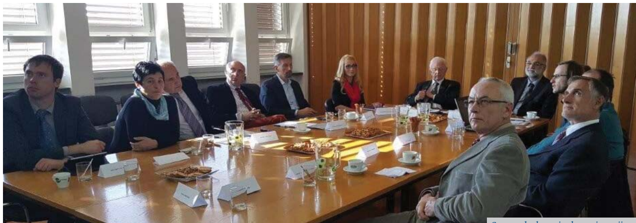
Sastanak alumni udruga iz regije

Na inicijativu ALUMNI društva Fakultete za strojništvo, Univerze u Mariboru 12. studenog 2015. godine na Fakulteti za strojništvo održan je prvi sastanak ALUMNI udruga iz regije. Sastanak je organiziran u cilju unaprjeđenja suradnje udruga i sudjelovanje u projektima od zajedničkog interesa. Sastanku su prisustvovali predstavnici ALUMNI udruga sa sljedećih fakulteta: Strojniški fakultet Univerze u Mariboru, Strojniški fakultet Univerze u Ljubljani, Fakultet strojarstva i računarstva Sveučilišta u Mostaru, Tehnički fakultet Sveučilišta u Rijeci i Fakultet strojarstva i brodogradnje Sveučilišta u Zagrebu.