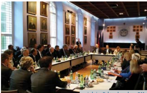
1. sjednica Rektorskog zbora RH