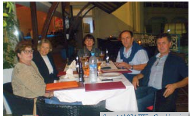
Susret AMCA TTF u Casablanci

Ovu godinu udruhu AMCA TTF je obilježio još jedan događaj druženja, susret alumna AMCA TTF na afričkom kontinentu, u Casablanci.