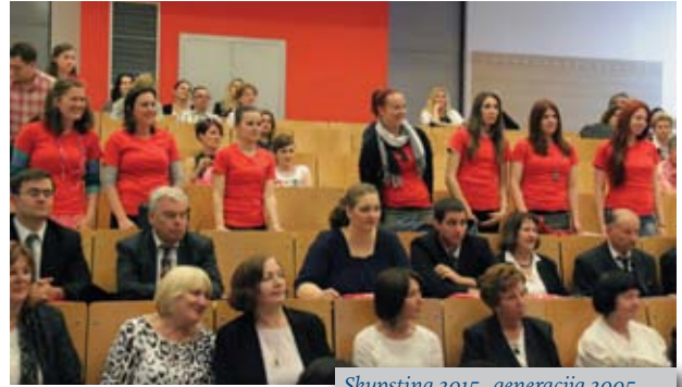
Skupština 2015., generacija 2005.

Udruga nastavlja okupljanje generacije studenata koje tradicionalno poziva na Godišnju skupštinu. Ovog puta to je bila 1. generacija mag. ing. tekstilne tehnologije, upisana 2005./2006.