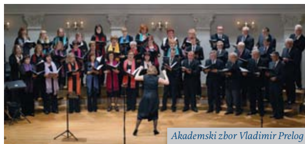
Akademski zbor Vladimir Prelog

Najstarija sekcija AMACIZ-a, Akademski zbor Vladimir Prelog, u jeku je priprema za svoju 25. godišnjicu u 2016. Program godišnjeg koncerta, održanog 8. ožujka 2015. u Hrvatskom glazbenom zavodu (HGZ), predstavljao je repertoarni iskorak u odnosu na dosadašnje i uključivao je zbarske obrade suvremenih popularnih pjesama uz solističke nastupe članova zbora, kojima je to bio prvi javni nastup. S takvim repertoarom Zbor je nastavio nastupati tokom godine: u Ozlju, na 5. Festi Choralis Zagrabien-sis u HGZ-u, te na Festivalu amaterskog kulturnog stvaralaštva u Vrsaru i svuda ga je izvrsno primila publika. Zbor je sudjelovao i na 38. susretima zagrebačkih glazbenih amatera u Zagrebu . Jubilarni godišnji koncert održat će se 20. ožujka 2016., a program će biti presjek najuspješnijih skladbi koje je zbor izveo u proteklih pet godina.