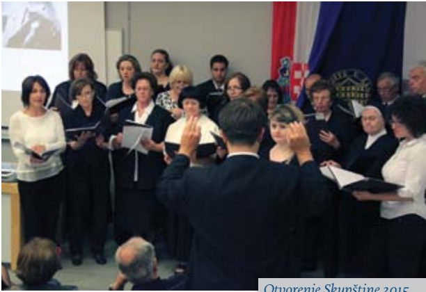
Otvorenje Skupštine 2015.

Udruga ostvaruje suradnju ima potporu tekstilnih tvrtki i ustanova koje su prepoznale važnost okupljanja tekstilaca. One obogaćuju rad AMCA TTF svojim predstavljanjem na skupštini u Glasniku, u vremenu globalnih ekonomskih poteškoća u gospodarstvu, poglavito u tekstilstvu.