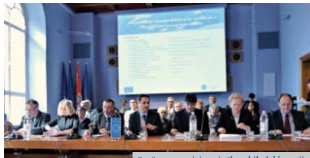
Svečano potpisivanje članskih deklaracija

učilišnoj inovacijskoj mreži pristupilo je 14 sastavnica Sveučilišta u Zagrebu, partneri na projektu BISTEC, kao i Sveučilište u Rijeci, Hrvatska mreža poslovnih anđela – CRANE, Hrvatska gospodarska komora, Tehnološki park Varaždin, Tehnološko-inovacijski centar Međimurje, Tehnološki park Zagreb te tvrtke Altpro d. o. o., Pliva Hrvatska d. o. o., Genera d. d. i SD Informatika d. o. o.