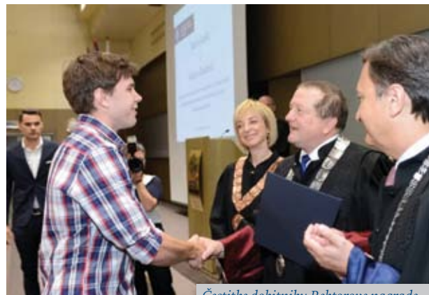
Čestitke dobitniku Rektorove nagrade