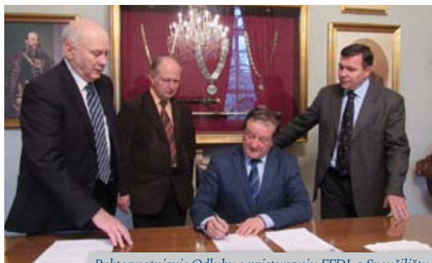
Rektor potpisuje Odluku o pristupanju FFDI-a Sveučilištu

8. prosinca 2015. - Senat Sveučilišta u Zagrebu donio je na petoj redovitoj sjednici u ak. god. 2015./2016., održanoj 8. prosinca 2015., Odluku o uključenju Filozofskoga fakulteta Družbe Isusove kao ustanove u sastav Sveučilišta u Zagrebu. Članovi Senata ovu su odluku donijeli jednoglasno. Odluci je prethodila propisana procedura u kojoj su Statutom predviđena sveučilišna tijela (Vijeće društveno-humanističkoga područja, Rektorski kolegij u širem sastavu) jednoglasnim odlukama poduprla inicijativu za uključivanje FFDI-a kao ustanove u sastav Sveučilišta. Odlukom Senata određeno je da će FFDI kao 34. sastavnica Sveučilišta u Zagrebu djelovati pod novim nazivom - Fakultet filozofije i religijskih znanosti (FFRZ).