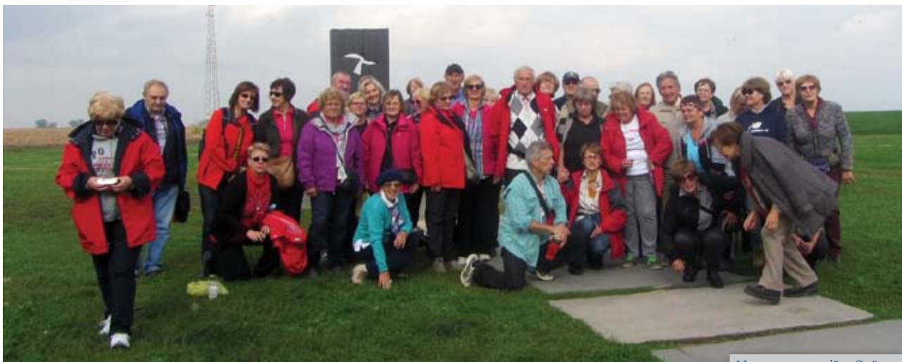
Na samom stratištu Ovčare