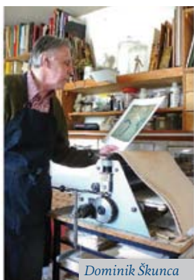
Dominik Škunca Atelier gravure

Jedna od najljepših umjetničkih večeri ove sezone održala se 27. svibnja u svečanoj dvorani Veleposlanstva Republike Hrvatske i bila je posvećena umjetniku Dominiku Škunci (1939., Novalja – 2011., Pariz). Nažalost, premalo je ljudi čulo za tog svestranog umjetnika, rođenog u Novalji na Pagu, koji je