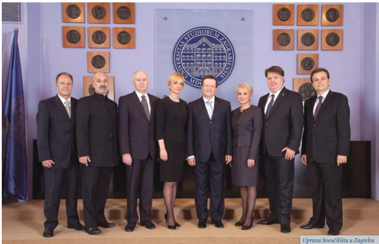
Uprava Sveučilišta u Zagrebu

Uzimajući u obzir viziju koju sam naveo u Programu rada , istaknuo bih kako je uprava Sveučilišta u Zagrebu inicirala mjeru o dodjeljivanju razvojnih koeficijenta javnim sveučilištima, predlažući Ministarstvu znanosti, obrazovanja i sporta (dalje: MZOS) način rješavanja problema oko 1400 znanstvenih novaka u sustavu visokog obrazovanja. To je rezultiralo preusmjeravanjem proračunskih sredstava sveučilištima u obliku razvojnih koeficijenta za raspisivanje natječaja i zapošljavanje mladog znanstvenog i nastavnog potencijala, od čega nešto manje od 1000 radnih mjesta za Sveučilište u Zagrebu. Nova uprava Sveučilišta u Zagrebu unaprijedila je svoje administrativne usluge prema sastavnicama Sveučilišta u Zagrebu pa je od listopada 2014. godine do kraja rujna 2015. godine znatno ubrzana administrativna procedura i izdano je dvostruko više suglasnosti sastavnicama za nova radna mjesta u odnosu na prethodne dvije akademske godine. Već sada, u 2015. godini izdano je preko 1000 suglasnosti za radna mjesta na Sveučilištu u Zagrebu.