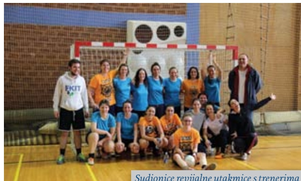
Sudionice revijalne utakmice s trenerima

Prirodoslovnoj školi Vladimira Preloga, uvijek ne-sebičnom i ugodnom domaćinu. Na susretu održanom 15. veljače 2015. uz natjecanja u malom nogometu (momčadi PLIVE, Petrokemije Kutina, PŠ V. Preloga, Instituta „Ruđer Bošković“, studenata FKIT-a, te AMACIZ-a – alumna FKIT-a), stolnom tenisu i šahu, publika je mogla uživati i u revijalnoj utakmici ženskih nogometnih ekipa PLIVE i studentica FKIT-a. Vodstvo sportske sekcije se nada da neće ponovno proći 15 godina do iduće revijalne „ženske“ utakmice – prethodna je održana povodom obilježavanja 10. obljetnice AMACIZ-a.