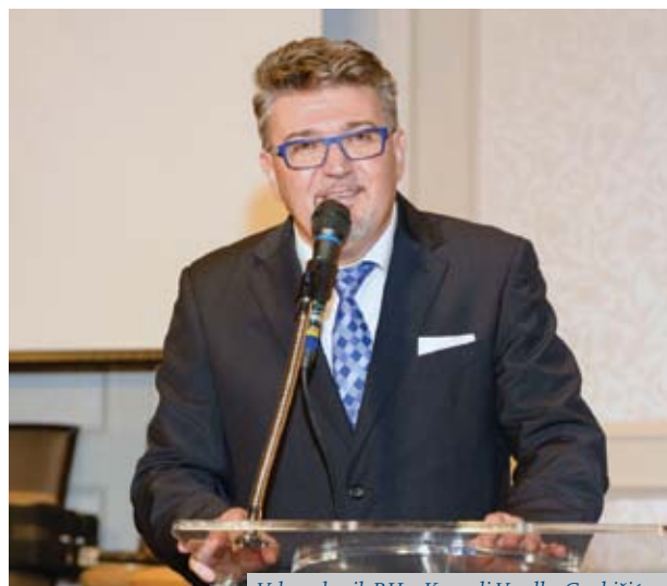
Veleposlanik RH u Kanadi Veselko Grubišić

Veleposlanik RH u Kanadi Veselko Grubišić obratio se prisutnima kratkim govorom, obavijestio ih da njegov mandat u Kanadi završava ove godine, te se tom prilikom oprostio sa svima i izrazio nadu da će se ponovo s njima sresti, u Hrvatskoj ili u Kanadi. Tokom večeri veleposlanik je razgovarao u lobiju Boulevard Cluba s mnogim gostima večeri, koji su bili ugodno iznenađeni njegovom neformalnom pristupačnošću.