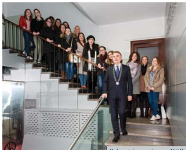
Dekan i zbor studenata SFZG

Te se večeri, dvadeset godina nakon apsolviranja, nisu reminiscirale ove teme. Četrdeset dvoje alumnija međusobno su si izgledali mlado kao onih godina, a dame su bile još ljepše nego onda. Zahvalan sam svim kolegama koji su se potrudili doći iz Zadra, Splita, Umaga, Graza i Bjelovara, uz ostale iz Zagreba i okolice. Svečani program je započeo u predavaonici Fakulteta, uz pjenušac i tortu. Prilikom ulaska nas je dočekalo iznenađenje - zbor studenata Stomatološkog fakulteta imao je svoju premijeru. Otpjevali su nam pjesmu „Milena, generaciju“ Novih fosila.