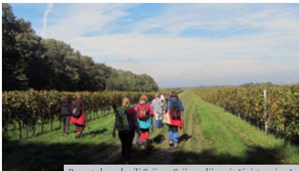
Povratak s vrha ili Srijem, Srijem...lijepo je živjeti u njem!

Praćeni simpatičnim policajcima kao da smo neke važne zvjerke, poljskom lenijom, pa potom kroz podnošljivo blato u kratkom šumskom odsjeku izbijamo na državnu granicu unutar plitkog iločkog džepa. Fotkanje i "Lijepa naša...". Na povratku nema magle, nepregledni vinogradi na gotovo ravnoj plohi između Fruške gore i Dunava.