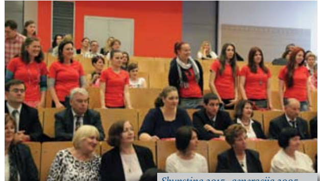
Skupština 2015., generacija 2005.

Udruga nastavlja okupljanje generacije studenata koje tradicionalno poziva na Godišnju skupštinu. Ovog puta to je bila 1. generacija mag. ing. tekstilne tehnologije, upisana 2005./2006.