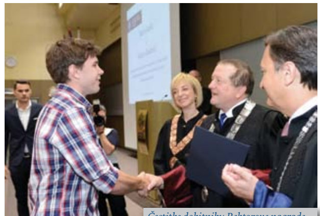
Čestitke dobitniku Rektorove nagrade