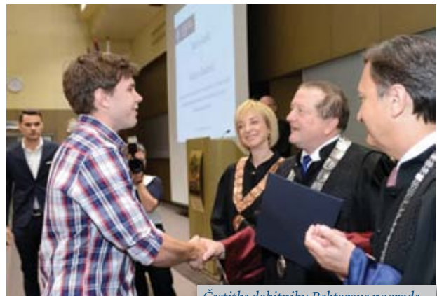
Čestitke dobitniku Rektorove nagrade