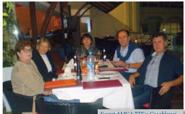
Susret AMCA TTF u Casablanci

Ovu godinu udругu AMCA TTF je obilježio još jedan događaj druženja, susret alumna AMCA TTF na afričkom kontinentu, u Casablanci.