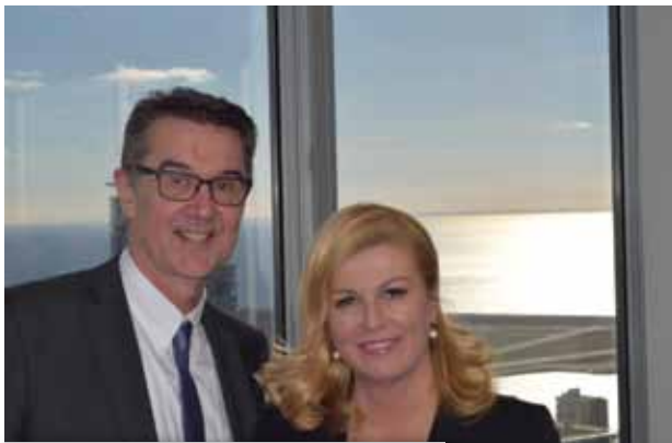
Krešimir Mustapić i Kolinda Grabar Kitarović

U uvodnoj riječi predsjednik AMCA-e Toronto Krešimir Mustapić podsjetio je na susret od prije točno deset godina, kad je AMCA Toronto ugostila ondašnju ministricu vanjskih poslova i europskih integracija, gospođu Grabar-Kitarović. "Nakon Vašeg izvanrednoga govora na Munk School of Global Affairs, te iz Vašeg nastupa, odmjerenosti i načina na koji ste odgovarali i na neka teška pitanja, dalo se naslutiti da će Vaša karijera nastaviti napredovati. Danas Vas ponovno ugošćujemo, ovog puta kao predsjednicu Republike Hrvatske" - rekao je u svojoj uvodnoj riječi g. Mustapić.