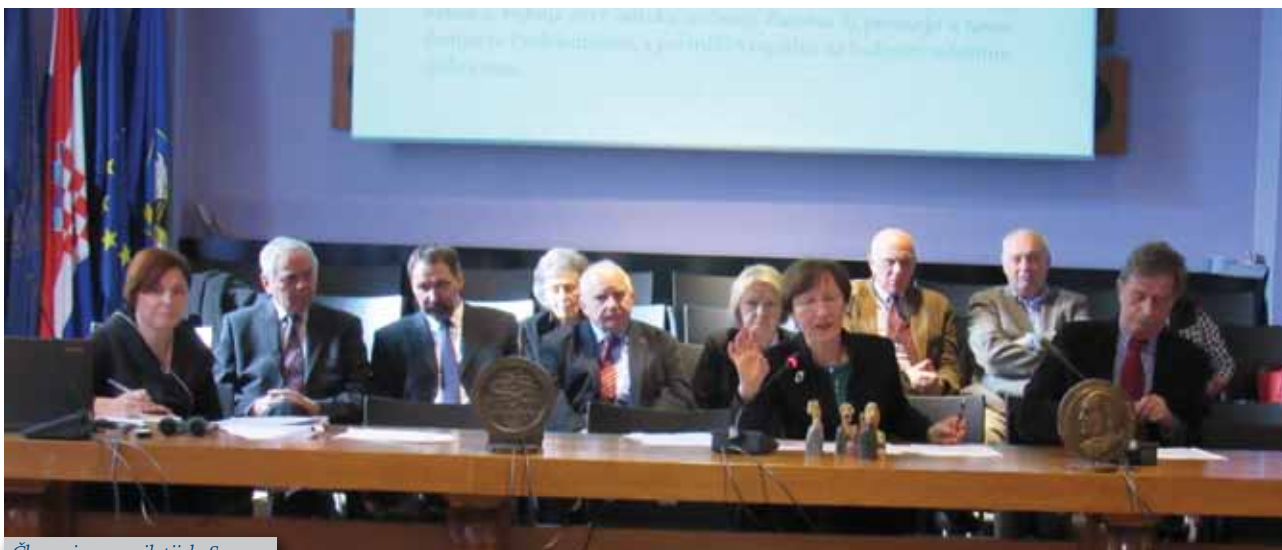
Članovi upravnih tijela Saveza

U auli Rektorata Sveučilišta u Zagrebu, 25. listopada 2016. održana je Skupština Saveza društava bivših studenata Sveučilišta u Zagrebu. Bila je to prigoda da se na jednom mjestu susretnu članovi alumni zajednice Sveučilišta u Zagrebu te razmjene iskustva u radu svojih udruga, ali se i bolje upoznaju kroz neformalno druženje nakon održane Skupštine.