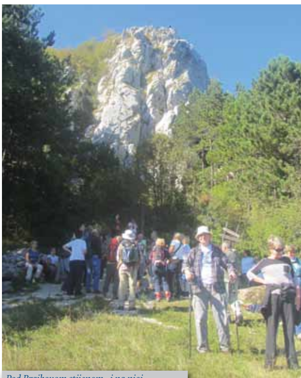
Pod Brajkovom stijenom...i na njoj

Planinarsko-izletnička sekcija opisuje svoje izlete u Bosansku Krupu, Korita (Istra), te starim cestama i mostovima do starih gradina i dvoraca (Novigrad, Bosiljevo, Modruš). Ovi su izvještaji popraćeni s odličnim fotografijama i opisima lijepih dijelova kojima izletnici prolaze.