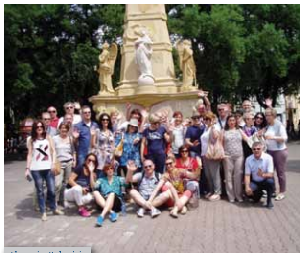
Alumni u Subotici

Slijede sadržaji koji se odnose na alumni djelovanja. Informira se o okupljanjima alumna prigodom godišnjica upisa na fakultet. U ovom broju su opisana tri takva okupljanja: povodom 55 (poseban članak na str. 16) i 60 godina od upisa kada su se alumni sastali na FKIT-u, te okupljanje mlađih kolega koji su svoj sastanak održali izvan Zagreba, ovaj puta u Subotici.