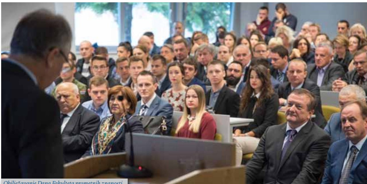
Obilježavanje Dana Fakulteta prometnih znanosti