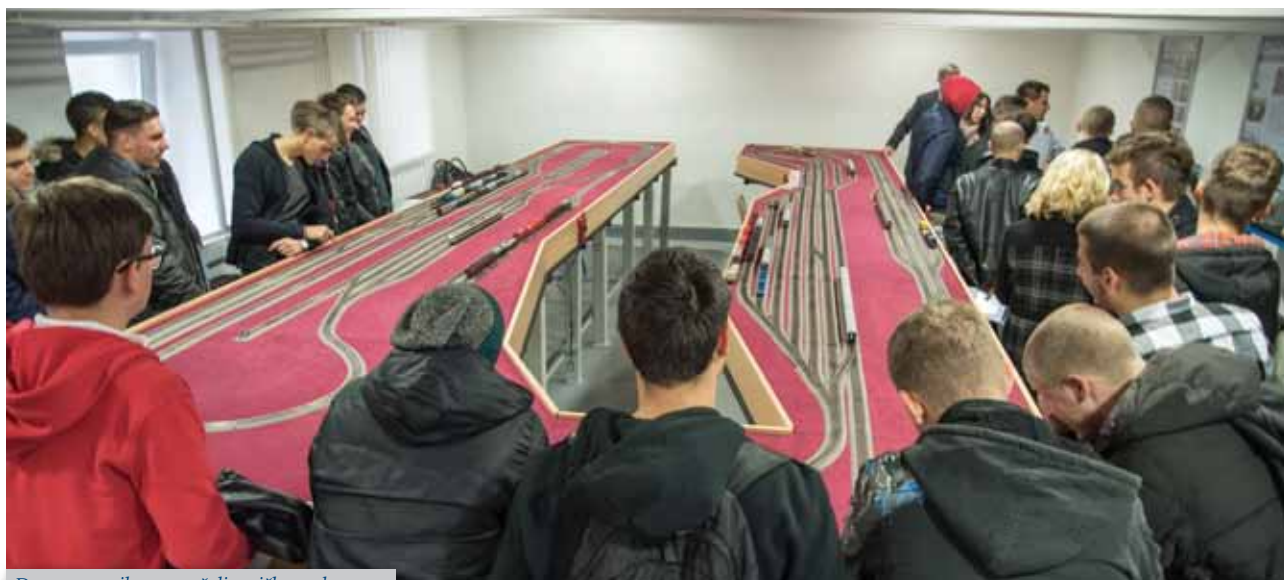
Dan otvorenih vrata - željeznička maketa

Znanstveno-istraživački i stručni rad je organiziran kroz zavode i zavodske laboratorije. Laboratoriji su opremljeni suvremenom mjernom, programskom i komunikacijskom opremom pretežno nabavljenom iz vlastitih sredstava Fakulteta. Katalog opreme i programskih paketa fakultetskih laboratorija se kontinuirano ažurira i javno je dostupan.