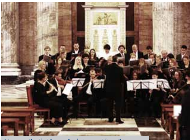
Nastup u Bazilici Svetog Pavla izvan zidina, Rim, 2014.