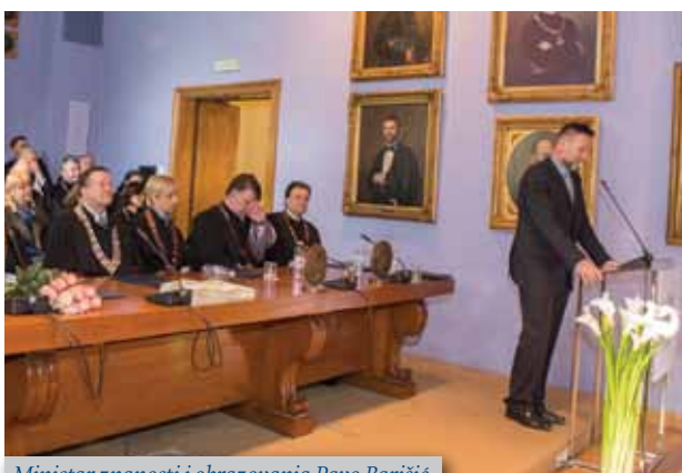
Ministar znanosti i obrazovanja Pavo Barišić

Strossmayera i bana Ivana Mažuranića. Upravo zahvaljujući zaslužnim hrvatskim prosvjetiteljima kao i svekolikom razvoju tadašnje Hrvatske stasalo je danas najveće sveučilište u Republici Hrvatskoj i svakako jedno od najuglednijih u ovom dijelu Europe. Metaforički je usporedio Sveučilište sa svjetionikom koji stoljećima svojim svjetlom znanja i otkrivanja istine obasjava prostore Hrvatske i jugoistočne Europe. Tome u prilog najbolje govori činjenica kako Sveučilište danas ima 34 sastavnice, 30 fakulteta, 3 akademije i 1 sveučilišni centar. Istaknuo je, kako je cijela mreža visokih učilišta u Lijepoj našoj respektabilna, ali ipak po svojoj prepoznatljivosti i ugledu zagrebačko sveučilište ostaje jedinstveno, ono je stožer i središte, kako znanstvenoga, tako i nastavnoga visokoškolskog djelovanja u Republici Hrvatskoj.