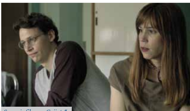
Scena iz filma „Cvijeće“