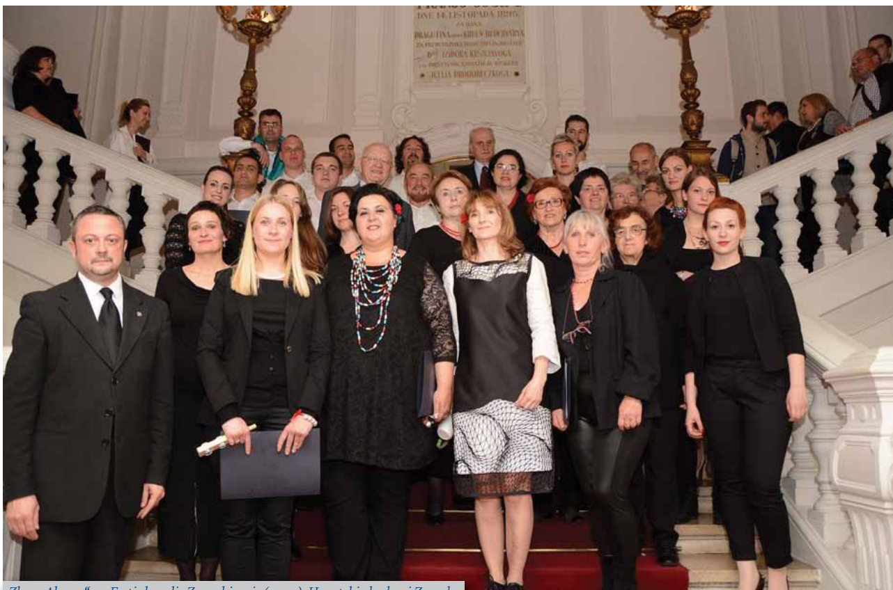
Zbor „Ab ovo“ na Festi choralis Zagrabienis (2015.), Hrvatski glazbeni Zavod