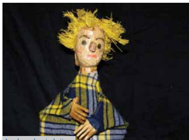
Lutak s naslovnice knjige

Knjiga mi je puno značila, jer sam magisterij napisao nakon prometnog udesa. Rad u drvu je na neki način za mene imao i terapijsko značenje. Već ranije sam prepoznao da djeca izuzetno dobro reaguju na lutke naravno ukoliko to isto čini terapeut. Naslov knjige mi je podarila jedna djevojčica koja je na pitanje što sve mora imati lutka odgovorila; „.. treba imati i srce i pamet...“ I zaista u terapiji s lutkama ne ide jedno bez drugoga. Kao dječji terapeut smatram da dijete treba odabrati oblik izražavanja i komunikacije, terapeut ga slijedi kao što igla na gramofonu ureze na ploči. Terapiji je imanentan proces rasta i razvoja.