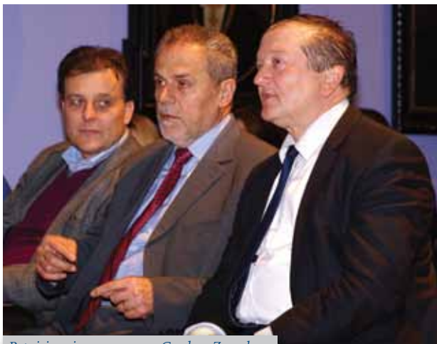
Potpisivanje sporazuma s Gradom Zagrebom