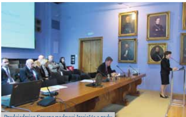
Predsjednica Saveza podnosi Izvješće o radu

U auli Rektorata Sveučilišta u Zagrebu, 25. listopada 2016. održana je Skupština Saveza društava bivših studenata Sveučilišta u Zagrebu. Bila je to prigoda da se na jednom mjestu susretnu članovi alumni zajednice Sveučilišta u Zagrebu te razmjene iskustva u radu svojih udruga, ali se i bolje upoznaju kroz neformalno druženje nakon održane Skupštine.