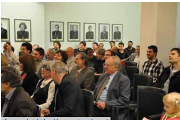
Sotvorenja izložbe „Na ramenima divova“