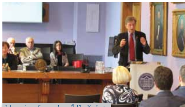
Izlaganje prof. emer. dr. sc. Željka Korlaeta

Istaknula je kako je glavni cilj ove Skupštine pripremiti sve preduvjete za legitimno i uspješno održavanje Izborne skupštine u 2017. godine te zamolila člana Predsjedništva Željka Korlaeta da izvijesti o aktivnostima Predsjedništva u tome smislu.