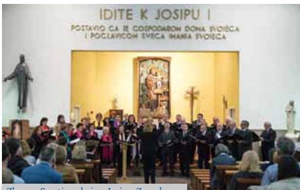
Zbor na Smoti u crkvi sv. Josipa, Zagreb

noj smotri, 39. susretima zagrebačkih glazbenih amatera, u crkvi sv. Josipa na Trešnjevci, te kasnije na koncertu održanom u okviru Festivala glazbe Zagreb 2016. u organizaciji Centra za kulturu Maksimir i Centra za glazbu Zagreb u maloj dvorani KD Vatroslava Lisinskog.