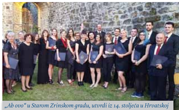
„Ab ovo“ u Starom Zrinskom gradu, utvrđi iz 14. stoljeća u Hrvatskoj Kostajnici povodom proslave 450. obljetnice bitke kod Sigeta, 2016. g.