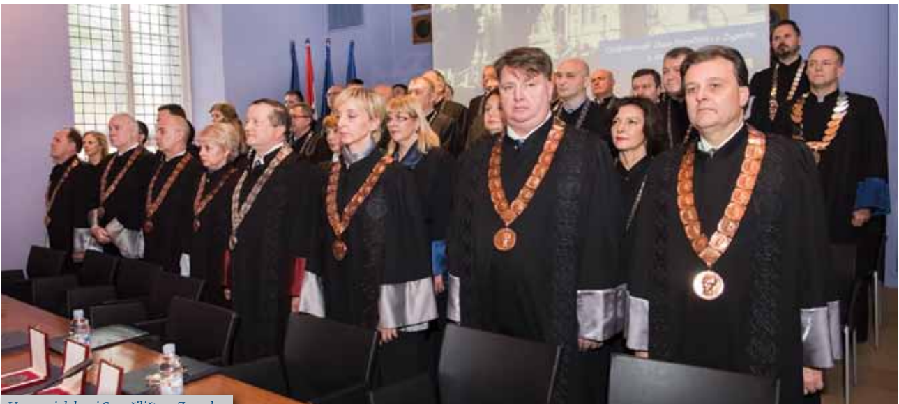
Uprava i dekani Sveučilišta u Zagrebu

Sveučilište u Zagrebu obilježava svoj Dies Academicus 3. studenoga. Tako je i na početku ove 348. akademske godine obilježavanje Dana Sveučilišta u Zagrebu započelo polaganjem vijenaca i odavanjem počasti preminulim profesorima i studentima na groblju Mirogoj. Po povratku sveučilišne delegacije, uz nazočnost brojnih uvažanih članova akademske zajednice i gostiju, održana je svečana sjednica Senata kojom je predsjedao rektor prof. dr. sc. Damir Boras. Program svečane sjednice započeo je državnim himnom koju je izveo Akademijski pjevački zbor Sveučilišta u Zagrebu osnovan 2016. godine. Svečanu sjednicu Senata pozdravnim govorom otvorio je rektor Boras, nakon čega su uslijedili pozdravni govori visokih uzvanika, prof. dr. sc. Šimuna Anđelinovića, predsjednika Rektorskoga zbora Republike Hrvatske, dok se u ime gradona-