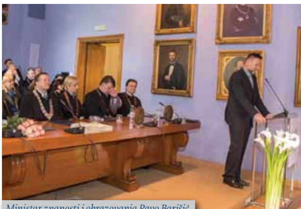
Ministar znanosti i obrazovanja Pavo Barišić

Strossmayera i bana Ivana Mažuranića. Upravo zahvaljujući zaslužnim hrvatskim prosvjetiteljima kao i svekolikom razvoju tadašnje Hrvatske stasalo je danas najveće sveučilište u Republici Hrvatskoj i svakako jedno od najuglednijih u ovom dijelu Europe. Metaforički je usporedio Sveučilište sa svjetionikom koji stoljećima svojim svjetlom znanja i otkrivanja istine obasjava prostore Hrvatske i jugoistočne Europe. Tome u prilog najbolje govori činjenica kako Sveučilište danas ima 34 sastavnice, 30 fakulteta, 3 akademije i 1 sveučilišni centar. Istaknuo je, kako je cijela mreža visokih učilišta u Lijepoj našoj respektabilna, ali ipak po svojoj prepoznatljivosti i ugledu zagrebačko sveučilište ostaje jedinstveno, ono je stožer i središte, kako znanstvenoga, tako i nastavnoga visokoškolskog djelovanja u Republici Hrvatskoj.