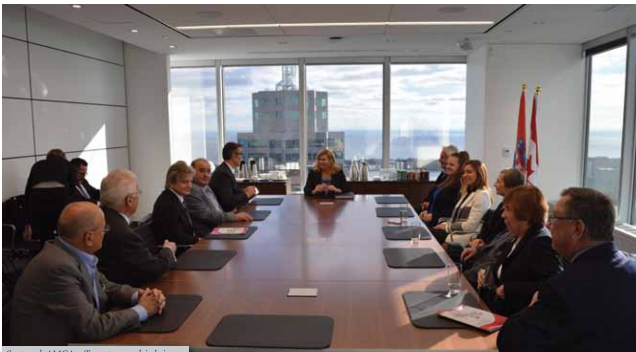
Sastanak AMCA-e Toronto s predsjednicom

U Torontu je ovih dana u radnom posjetu Kanadi bila predsjednica RH Kolinda Grabar-Kitarović. Uz vrlo užurban protokol, gospođa predsjednica izdvojila je popodne 22. studenoga za susret s predstavnicima AMCA-e Toronto u prostorijama tvrtke Stikeman Elliot LLP u Commerce Courtu u Torontu.