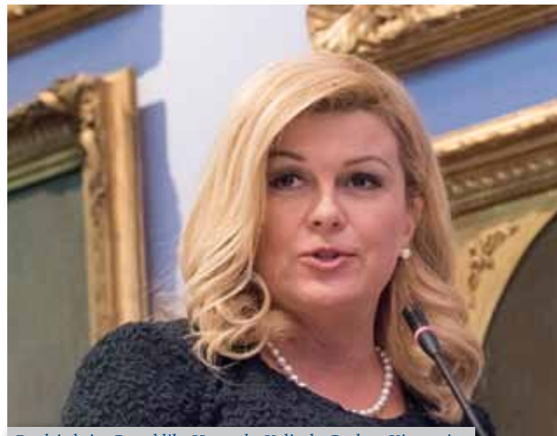
Predsjednica Republike Hrvatske Kolinda Grabar-Kitarović

izgradi Hrvatska kao zemlja obrazovanih, slobodnih, kreativnih i tolerantnih pojedinaca koji će u njoj vidjeti najbolje mjesto pod suncem za svoje ljudsko, profesionalno, znanstveno, akademsko i svako drugo ostvarenje.