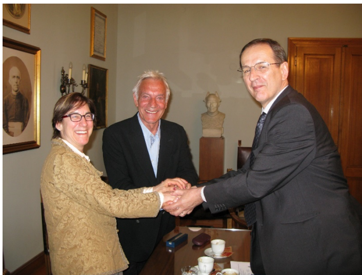
Potpisivanje Ugovora o suradnji između Sveučilišta u Zagrebu i Sveučilišta u Torontu