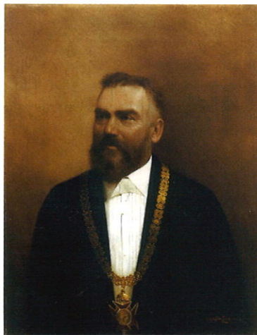
TADIJA SMIČIKLAS (Reštovo, 1. 10. 1843. – Zagreb, 8. 6. 1914.) prvi počasni doktor Sveučilišta u Zagrebu, promoviran 20. prosinca 1913.