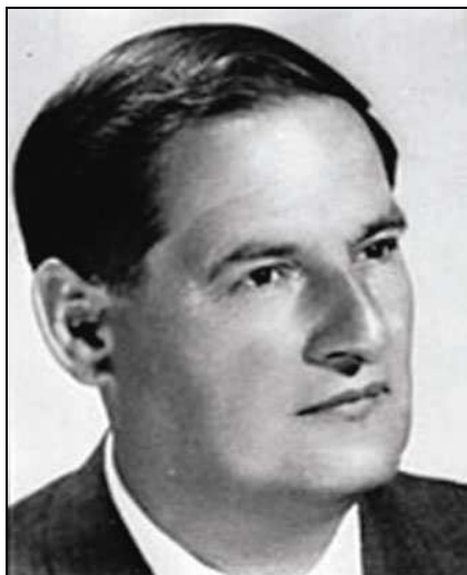
Karlovac, 29. srpnja 1907. – Zagreb, 15. ožujka 1979.