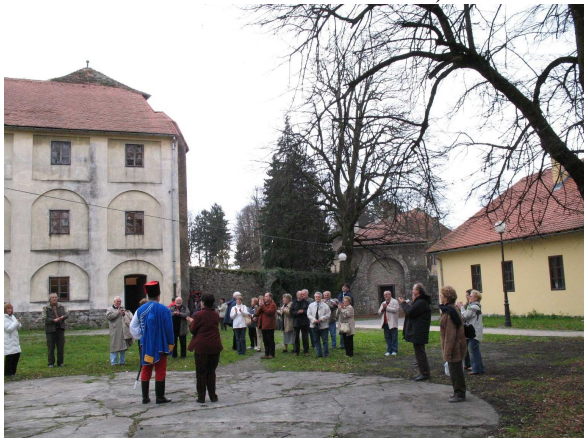
Fakultet prometnih znanosti Sveučilišta u Zagrebu poklonio je sudionicima Sabora izlet u Ogulin i Bjelolasicu

Fakultet prometnih znanosti, kao članica Sveučilišta u Zagrebu, njegujući njegove tradicije, osnovao je 22. ožujka 2002. Hrvatsku udrugu diplomiranih inženjera i inženjera Fakulteta prometnih znanosti (Almae Matris Alumni Croaticae – Facultas Studiorum communitas) AMAC FSC.