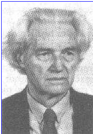
Zagreb, 8. travnja 1915. – Zagreb, 5. ožujka 2007.

U auli Sveučilišta u Zagrebu održana je 11. travnja 2007. komemoracija kojom je odana počast te su iznesena sjećanja na profesora Ivana Supeka, rektora Sveučilišta u Zagrebu od 1968. do 1972., profesora koji je svojim dugogodišnjim djelovanjem zadužio i naše sveučilište i cjelokupnu hrvatsku kao i međunarodnu akademsku zajednicu. Prof. I. Supek preminuo je 5. ožujka 2007. u svom domu. Nazočni su minutom šutnje odali počast preminulom profesoru, nakon čega su trojica profesora, njegovi studenti odnosno suradnici, prigodnim riječima iznijeli svoje utiske o životnom putu, djelu i zaslugama Ivana Supeka.