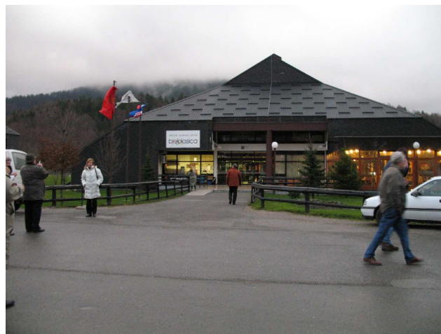
Ogulinske »vještice« i Hrvatski olimpijski centar Bjelolasica

Druga dana Sabora, 25. studenoga 2006., sudionici su uz korisno i ugodno druženje upoznali ogulinski kraj