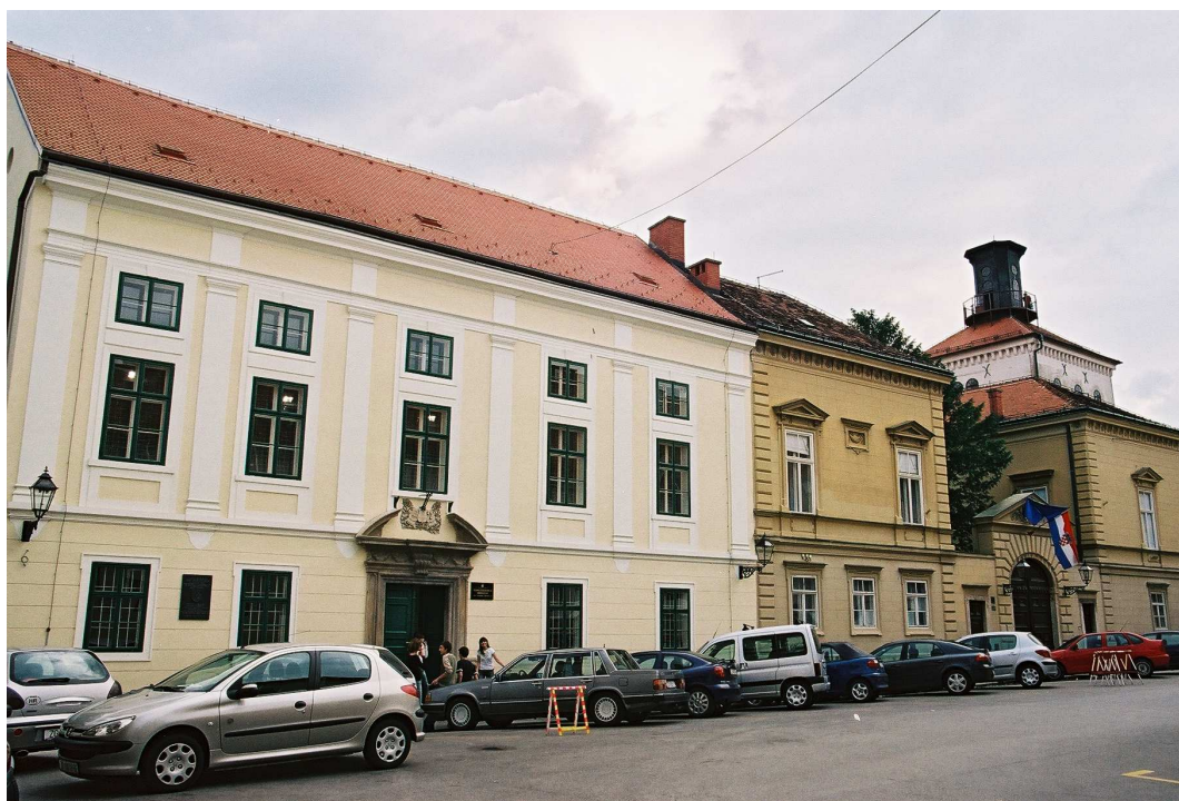
Povijesna zgrada Klasične gimnazije i Akademije odnosno Sveučilišta na Katarinskom trgu 5 u Zagrebu

Među iznimne ovogodišnje događaje svakako treba ubrojiti i proslavu 400. obljetnice osnutka Klasične gimnazije u Zagrebu. Tu su školu osnovali isusovci samo nekoliko mjeseci nakon svojeg dolaska u Zagreb. Od tada Klasična gimnazija djeluje kontinuirano punih 400 godina pa je i danas pohađa oko 600 učenika u 20 razreda. Njezini profesori i učenici pod vodstvom ravnateljice Anđelke Dukat, cijelu su školsku godinu 2006./2007. posvetili obilježavanju obljetnice koja se održavala pod visokim pokroviteljstvom Hrvatskoga sabora, Hrvatske akademije znanosti i umjetnosti te Sveučilišta u Zagrebu.