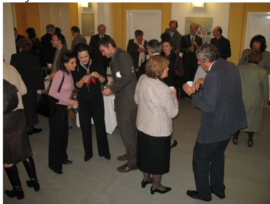
Sudionici Sabora u pauzi

Planinarska sekcija organizira prosječno šest izleta godišnje od Kutine do Velebita, Učke, Žumberka, Zagorja i Međimurja.