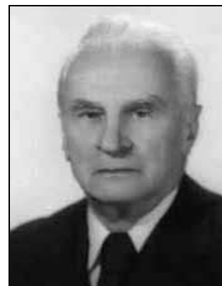
Varaždin, 27.7.1907. – Zagreb, 16.5.1980.