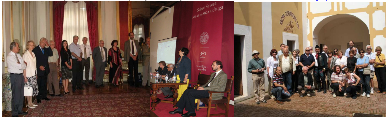
Sudionici Sabora imali su 2. srpnja 2009. primanje s prigodnim koncertom i domjenkom u gornjogradskoj palači Dverce, a 3. srpnja 2009. proveli su u ugodnom druženju na izletu po »Plemenitoj općini Turopolje«