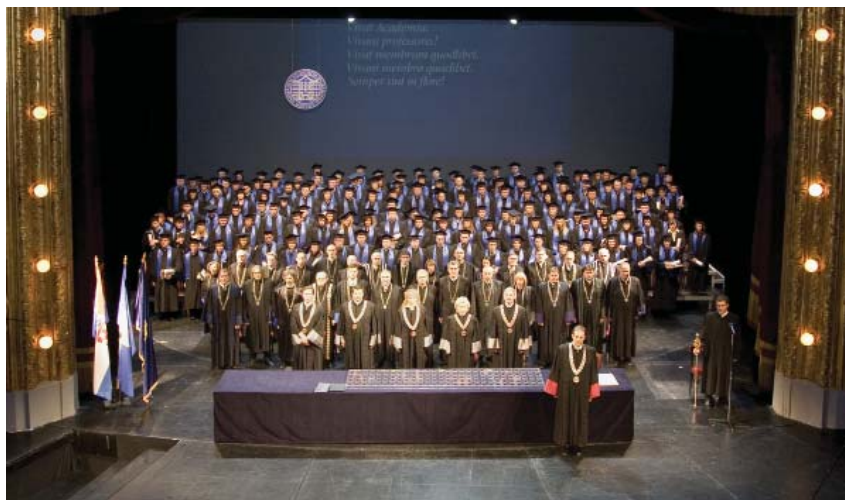
Promocija doktora znanosti Sveučilišta u Zagrebu, HNK