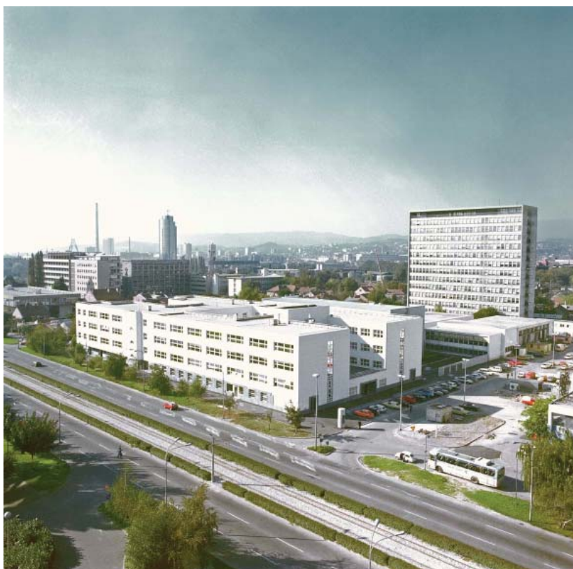
Zgrada Fakulteta elektrotehnike i računarstva Sveučilišta u Zagrebu

(vi) š t i ć e n j e zajedničkih interesa Sveučilišta i alumnijske. Sve za dobrobit Sveučilišta i njegovih alumnijske i prijatelja! Oni koji prate razvoj i djelovanje Saveza AMAC – UZ, složit će se da, polako, ali sigurno, Savez Alma Mater Alumni Sveučilišta u Zagrebu ispunjava svoju misiju. Najnovije mjere bit će već spominjana zajednička adresa alumnijske i zajednička akcija Saveza i Sveučilišta kao zakladnika - Zaklade Sveučilišta u Zagrebu. Obje su akcije integrirajuće i pobliže o njima molim pročitate u prilogima današnjeg gosta urednika gospodina Srećka