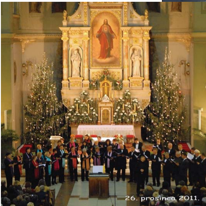
Božićni koncert u Bazilici Srca Isusova u Zagrebu

Osvrt na 20 godina djelovanja Planinarsko-izletničke sekcije u planinarskom duhu dao su prvi pročelnik sekcije dr.sc. Emir Hodžić, koji nas je odveo na prvi izlet 10.05.1992. koji se održao na Sljemenju s 40 članova. Kroz dugi niz godina članovi planinarske sekcije obišli su 19