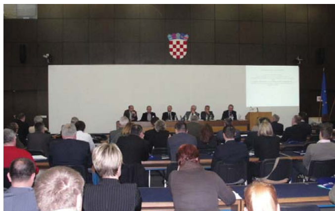
Sudionici ZIRP-a 2012 tijekom jedne od panel diskusija

Savjetovanje je okupilo stotinjak sudionika iz znanstvenih institucija, gradskih i državnih poduzeća te ostalih gospodarskih subjekata. Prijavljen je 41 rad koji su izvjestitelji prezentirali sukladno tematskoj skupini kojoj pojedini rad pripada.