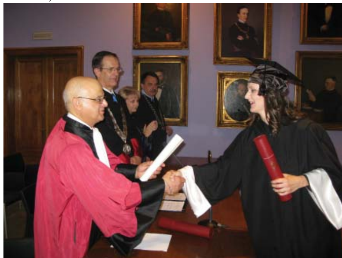
Podjela diplona magistra iz područja bioindustrije