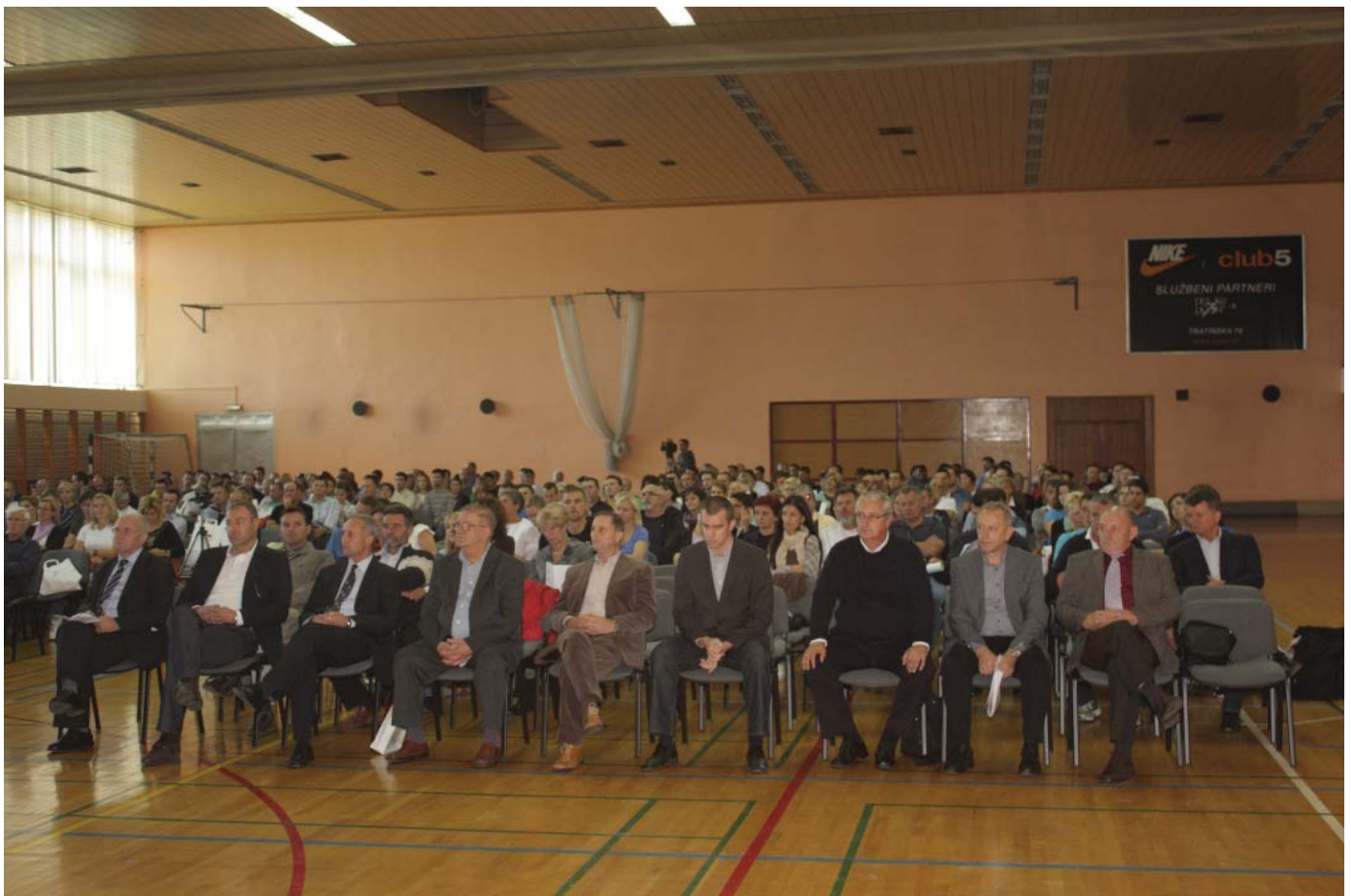
Na simpoziju „Školski sport“

Tekst: Dario Škegro, prof.