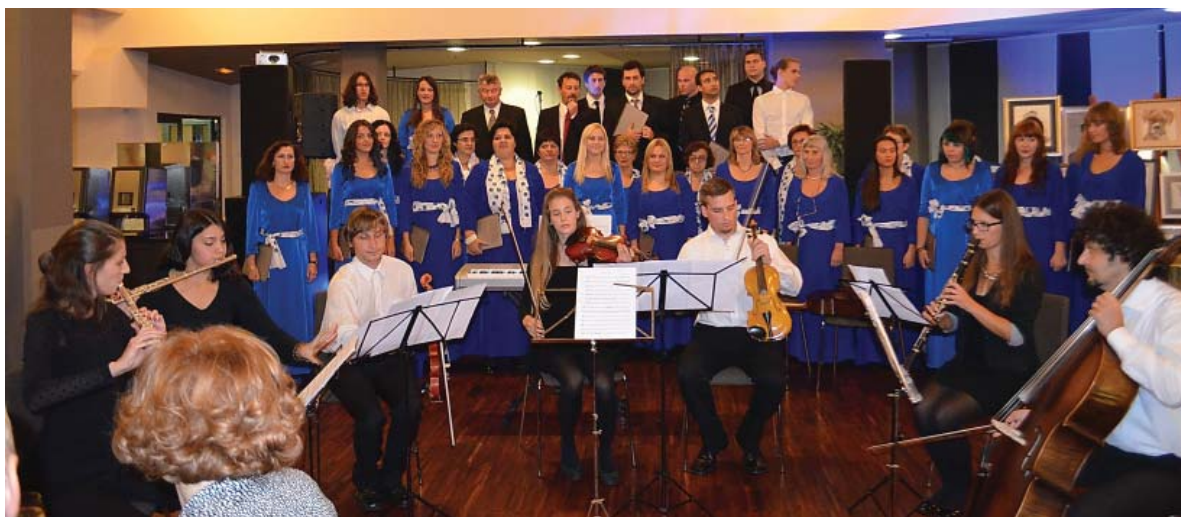
Nastup zbora „Ab ovo“ u pratnji orkestra na 5. Hrvatskom veterinarskom kongresu u Tuheljskim toplicama