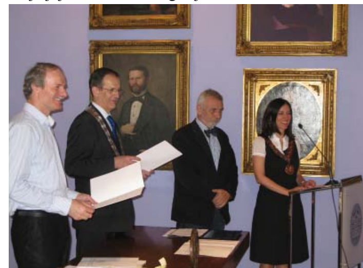
Dodjela stipendija Sveučilišta u Zagrebu

27. do 29. lipnja 2012. - na Sveučilištu u Zagrebu je održana godišnja međunarodna konferencija mreže European Access Network pod nazivom Access to Higher Education: is it a right, a privilege or a necessity? (Affordability, Quality, Equity & Diversity) . Ovogodišnja konferencija mreže European Access Network , na kojoj je sudjelovalo oko 130 sudionika iz dvadesetak zemalja Europe, Afrike, Sjeverne Amerike i Australije, bila je usmjerena na raspravu o pristupačnosti, kvaliteti, jednakosti i različitosti visokog obrazovanja, te o međudjelovanju i osiguravanju ovih načela u akademskom okruženju.