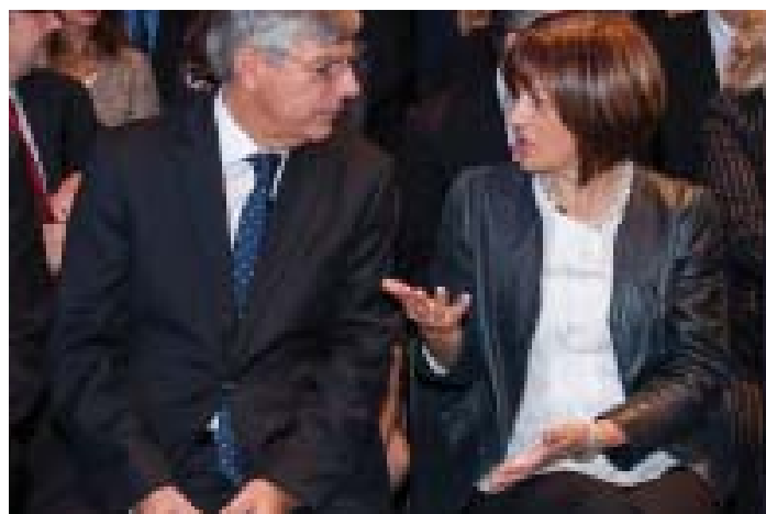
Uzvanici na svečanoj sjednici Senata Sveučilišta u Zagrebu