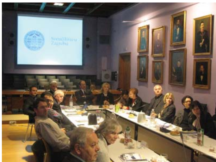
Sudionici Okruglog stola tijekom rasprave

ja. Iskoristio je prigodu zahvaliti gospodinu Tvrtku Andriji Mursalu, veleposlaniku u miru, koji je posredovao u donaciji hrvatskih iseljenika iz Južnoafričke Republike, koja čini najveći dio trenutnog temeljnog kapitala Zaklade. Trenutna sredstva kojima Zaklada raspolaže nisu velika, ali vjerujući da se pojedinci i institucije žele ponašati društveno odgovorno, ljestvicu smo postavili vrlo visoko te nam je cilj za temeljni kapital prikupiti 50 milijuna kuna. Ovaj je okrugli stol između ostalog bio jedan od načina za traženje modela kojim ćemo postići zadani cilj.