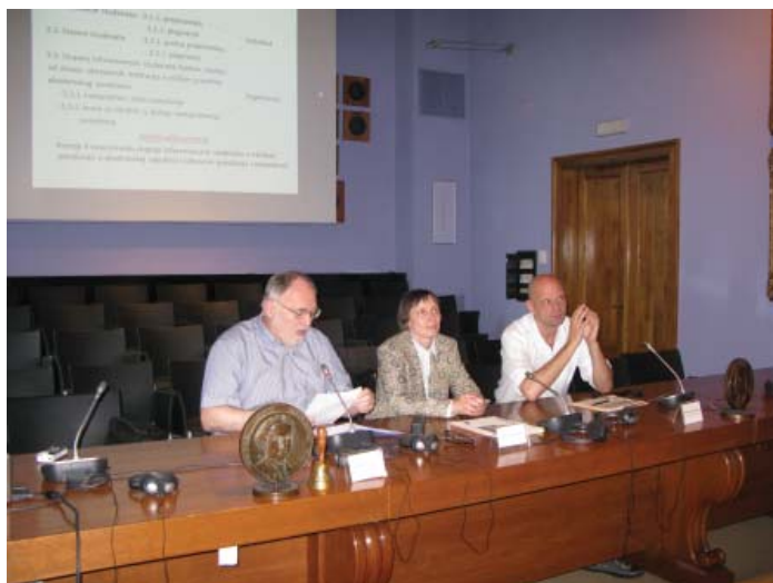
Sa simpozija o korupciji i diskriminaciji