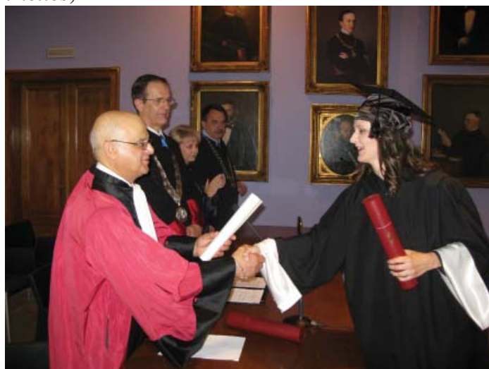
Podjela diplona magistra iz područja bioindustrije