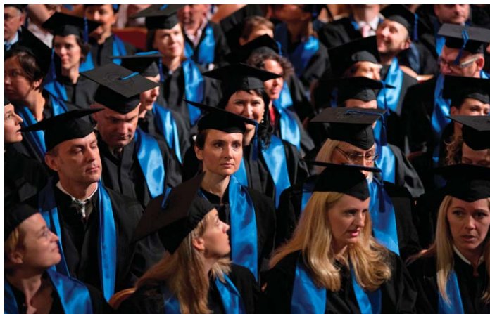
Novi doktori znanosti Sveučilišta u Zagrebu

stupnika, što je za 2012. godinu značajno više u odnosu na 760 promoviranih u 2011. te 496 promoviranih pristupnika u 2010. godini. Rektor prof. dr. sc. Aleksa Bjeliš se u svojim govorima posebno osvrnuo na trenutni položaj istraživačkog sustava u Republici Hrvatskoj te istaknuo kako bi on jednako kao i bilo koji drugi nacionalni sustav, izgubio smisao i budućnost ukoliko ne bi na optimalan način bio dio nacionalne investicijske strategije razvoja, temeljenog na kreativnosti i novim tehnologijama u najširem smislu riječi . Rektor Bjeliš se osvrnuo i na recesijske restrikcije koje traju već nekoliko godina, a zacrtane su u proračunskim smjernicama za sljedeće razdoblje, zbog čega je u opasnost doveden i istraživački sektor razvijan u proteklih nekoliko desetljeća.