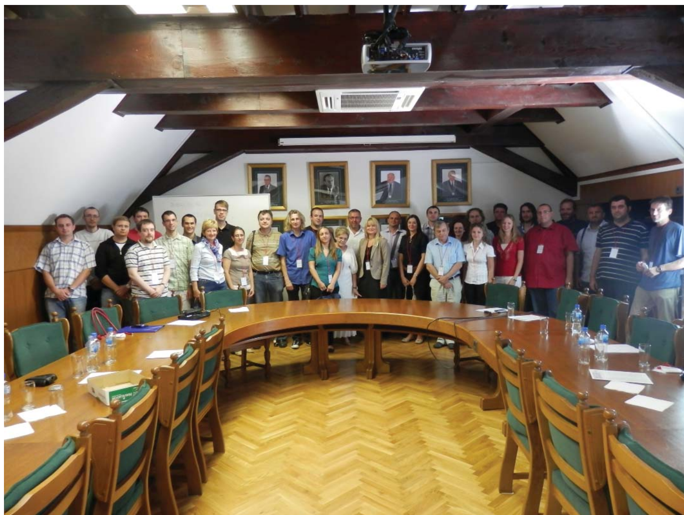
Sudionici okruglog stola „50 godina FOI“

Tekst: doc. dr. sc. Sandra Lovrenčić