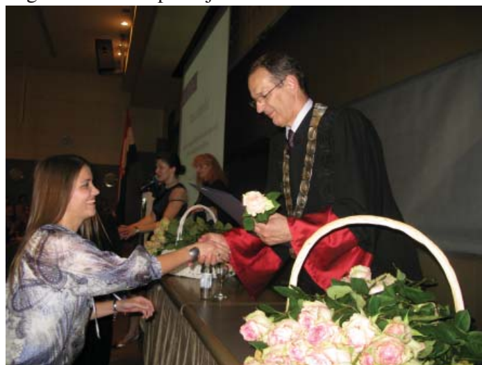
Dodjela Rektorove nagrade