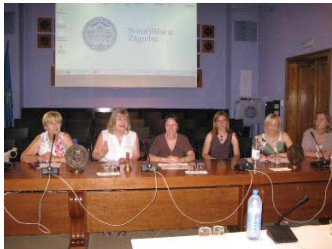
Škola hrvatskog jezika i kulture

hrvatskoga jezika dijeli se na tri razine – početnu, srednju i naprednu.