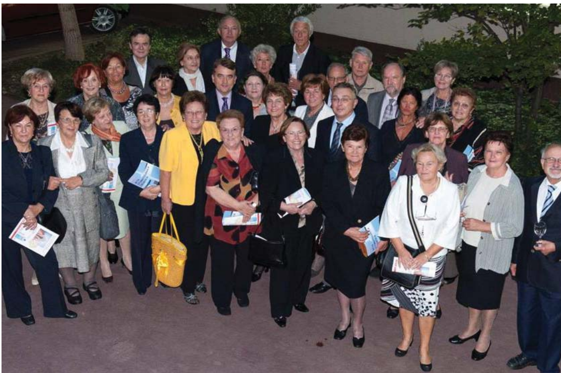
Skupina doktora stomatologije/dentalne medicine, pripadnika prve generacije studenata koja je 1962. upisala samostalni Stomatološki fakultet

jom alumni društva – AMCA Domus Stomatološkog fakulteta Sveučilišta u Zagrebu.