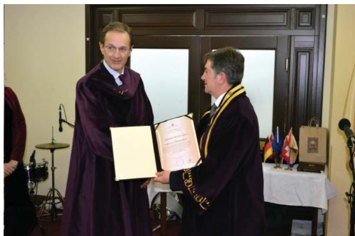
S dodjele počasnoga zvanja professor honoris causa Sveučilišta "St. Kliment Ohridski" u Bitoli