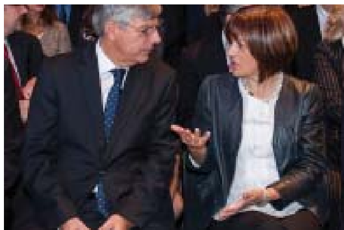
Uzvanici na svečanoj sjednici Senata Sveučilišta u Zagrebu