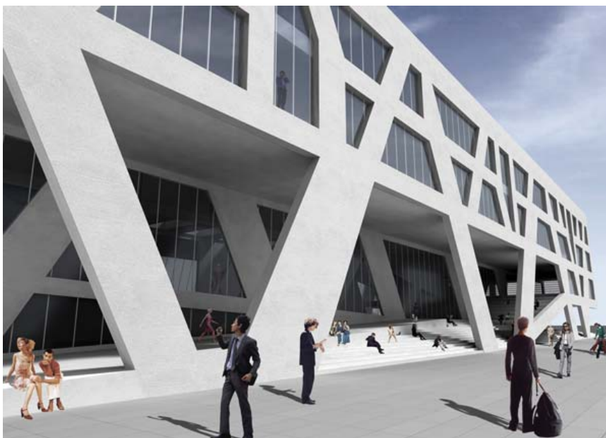
Iz projekta nove zgrade Građevinskog fakulteta u Osijeku http://www.trinas.hr/

a to je osnivanje krovne organizacije alumni udruge svih hrvatskih sveučilišta, čime bi se otvorila vrata za bolju suradnju sa AMAC Mundus udrugama, čiji članovi nisu vezani na pojedina visoka učilišta već okupljaju alumne svih hrvatskih sveučilišta uključujući i one iz Mostara, a neke čak i iz Sarajeva. Predavanje je zaključio konstatacijom da alumni predstavljaju bitan stup sveučilišta, a njihova snaga leži u njihovoj brojnosti. S dobrom