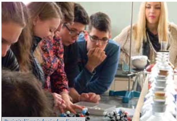
Posjetitelji na jednoj od radionica

Farmaceutsko-biokemijski fakultet Sveučilišta u Zagrebu po treći put otvorio je svoja vrata široj javnosti 15. studenoga 2014. i kroz radionice o temi Od molekule do lijeka predstavio farmaceutsku i medicinsko-biokemijsku struku.