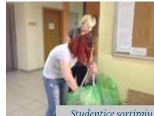
Studentice sortiraju prikupljene proizvode

Posebnu smo pažnju posvetili odabiru tema pod nazivom „Alumni dani“. Ova manifestacija dobila je svoje značajno mjesto prigodom obilježavanja rođendana Fakulteta. Naši mladi alumni/e, priznati stručnjaci u području Edukacijske rehabilitacije, Logopedije te Socijalne pedagogije u dva su dana prikazali najnovije stručne teme i probleme kojima se uspješno ili inovativno bave u zadnjih godinu dana. Odabrane radionice bile su namijenjene mentorima studenata i vanjskim suradnicima Fakulteta, naravno za sva tri studijska programa (tablica 1. Prikaz tema i predavača).