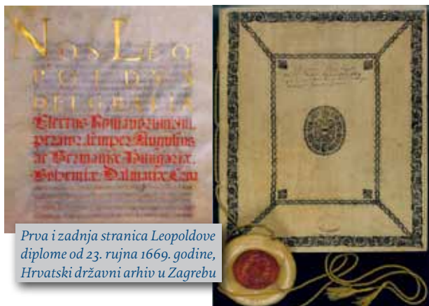
Prva i zadnja stranica Leopoldove diplome od 23. rujna 1669. godine, Hrvatski državni arhiv u Zagrebu

Sveučilište u Zagrebu obilježilo je 2014. godine dvije značajne obljetnice, 345 godina od utemeljenja uz Dan Sveučilišta 3. studenoga i 140 godina od osnutka modernoga sveučilišta 19. listopada. Valja naglasiti, prvi oblici visokoškolske nastave javljaju se 1607. godine u krilu isusovačke gimnazije. Teološki studij započeo je 1633. osnutkom posebne katedre za moralno bogoslovlje. Kolegijski kroničar bilježi 6. studenoga 1662. početak filozofskog tečaja, u ono vrijeme temelja svakog sveučilišnog studija pa se ta godina uzima kao početak visokoškolske nastave u Zagrebu. Više od 350 godina kontinuirane visokoškolske nastave na prvi se pogled ne čini se tako dugo jer znamo da povijest prvih europskih sveučilišta seže u jedanaesto i dvanaesto stoljeće. Uoči li se povijesni položaj Hrvatske, zadivljuju početni napori za utemeljenje našega najstarijeg sveučilišta s neprekinutim djelovanjem u ovom dijelu Europe.