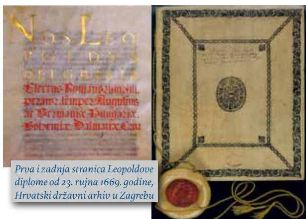
Prva i zadnja stranica Leopoldove diplome od 23. rujna 1669. godine, Hrvatski državni arhiv u Zagrebu

Sveučilište u Zagrebu obilježilo je 2014. godine dvije značajne obljetnice, 345 godina od utemeljenja uz Dan Sveučilišta 3. studenoga i 140 godina od osnutka modernoga sveučilišta 19. listopada. Valja naglasiti, prvi oblici visokoškolske nastave javljaju se 1607. godine u krilu isusovačke gimnazije. Teološki studij započeo je 1633. osnutkom posebne katedre za moralno bogoslovlje. Kolegijski kroničar bilježi 6. studenoga 1662. početak filozofskog tečaja, u ono vrijeme temelja svakog sveučilišnog studija pa se ta godina uzima kao početak visokoškolske nastave u Zagrebu. Više od 350 godina kontinuirane visokoškolske nastave na prvi se pogled ne čini se tako dugo jer znamo da povijest prvih europskih sveučilišta seže u jedanaesto i dvanaesto stoljeće. Uoči li se povijesni položaj Hrvatske, zadivljuju početni napori za utemeljenje našega najstarijeg sveučilišta s neprekinutim djelovanjem u ovom dijelu Europe.